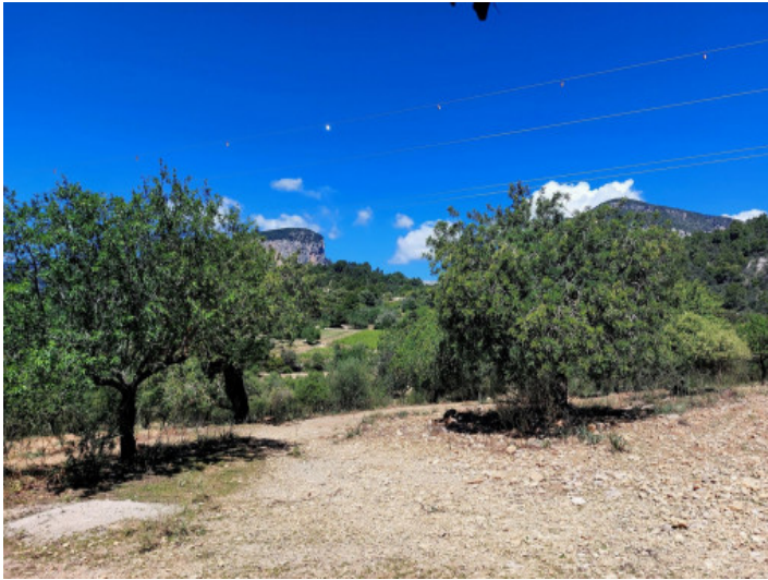
Terreno con proyecto