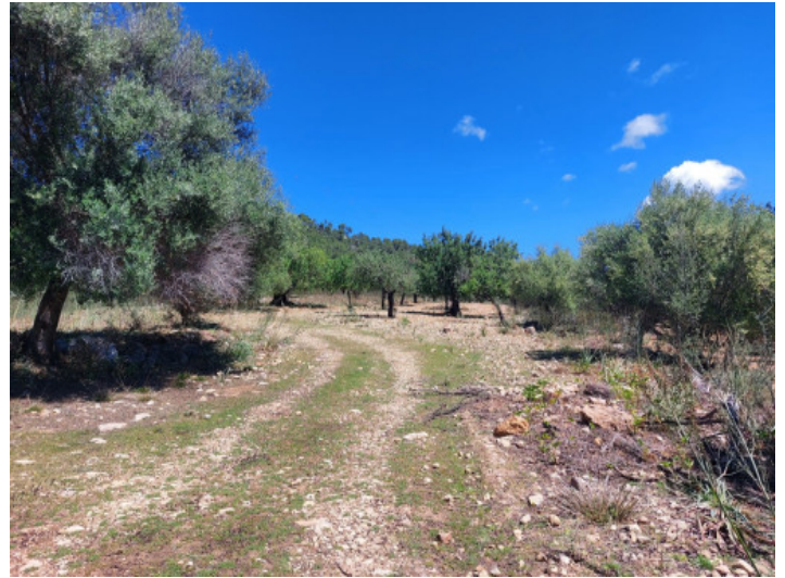
Entrada a la finca