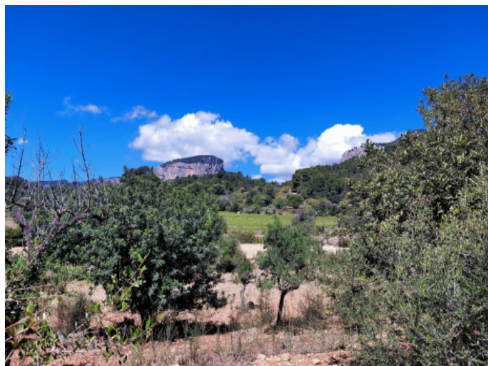
Terreno con project