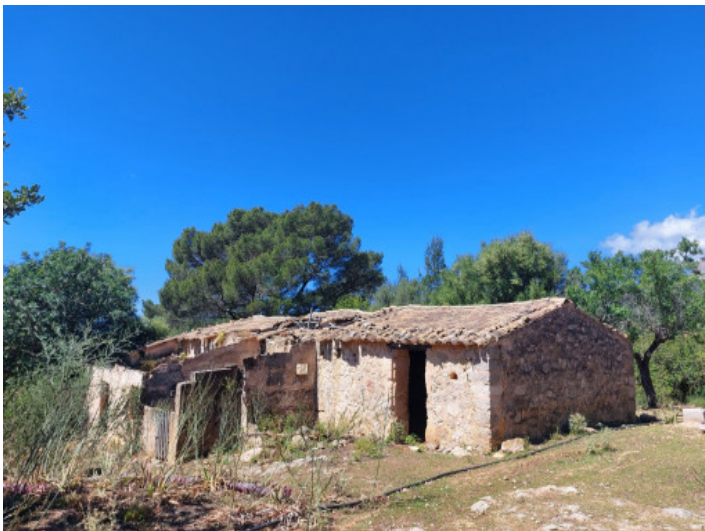
Terreno con project