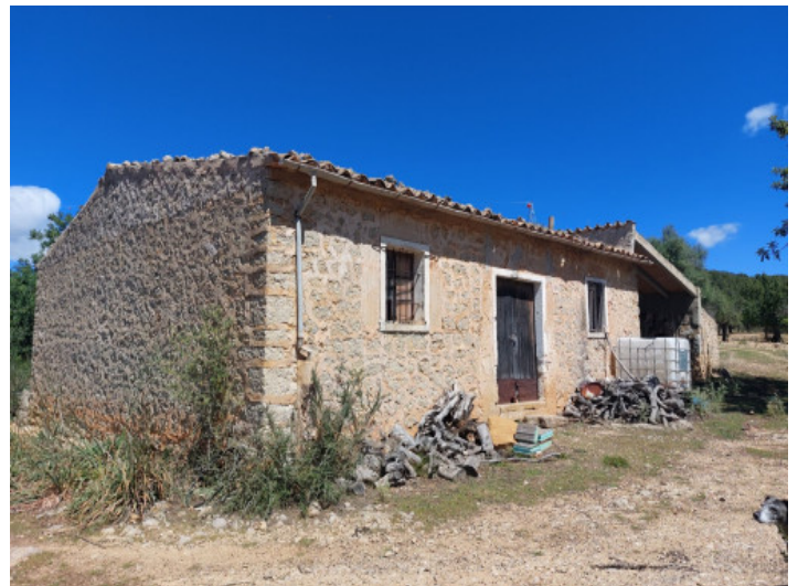
Terreno con project