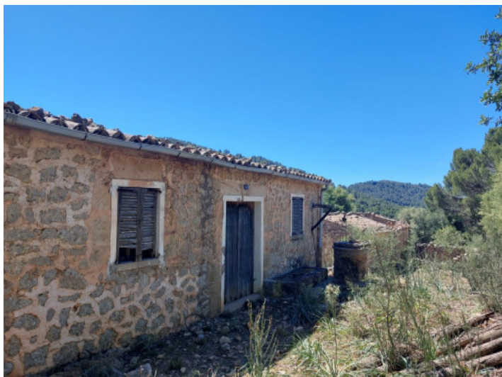
Terreno con project