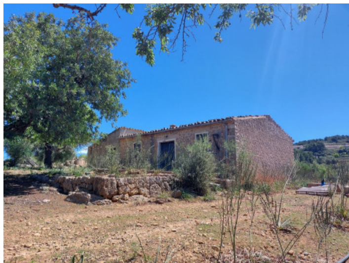
Terreno con project