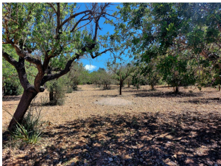
Terreno con project

Toda la información como mejor se puede saber, salvo por error durante el periodo de venta. Sirva este documento como un informe previo, las bases legales solo serán validas a traves de un contrato de compra acordado ante Notario.