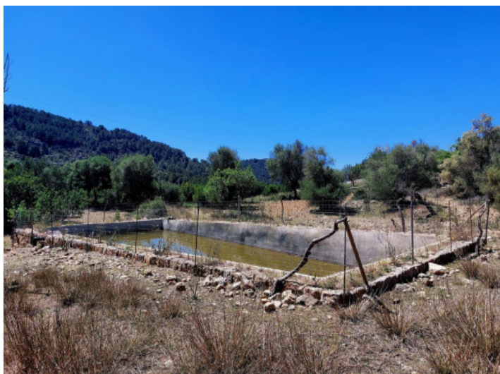
Terreno con project