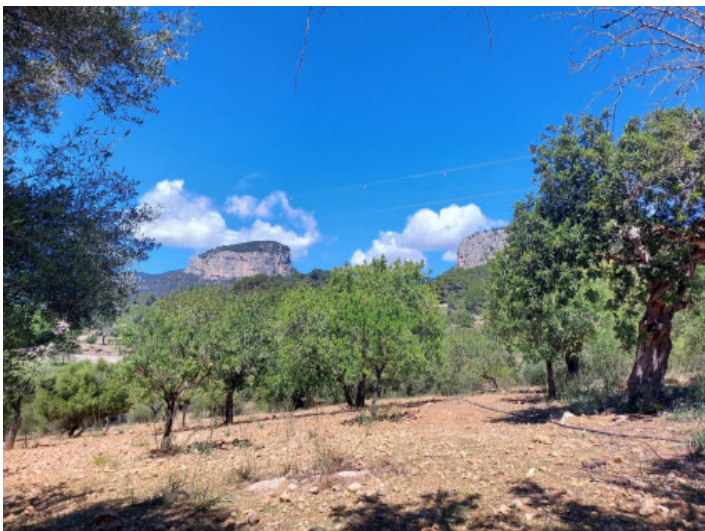
Terreno con project