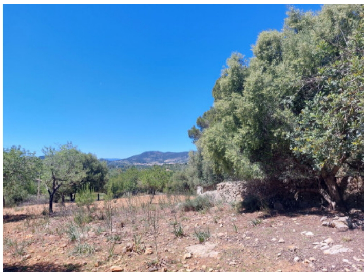
Terreno con project