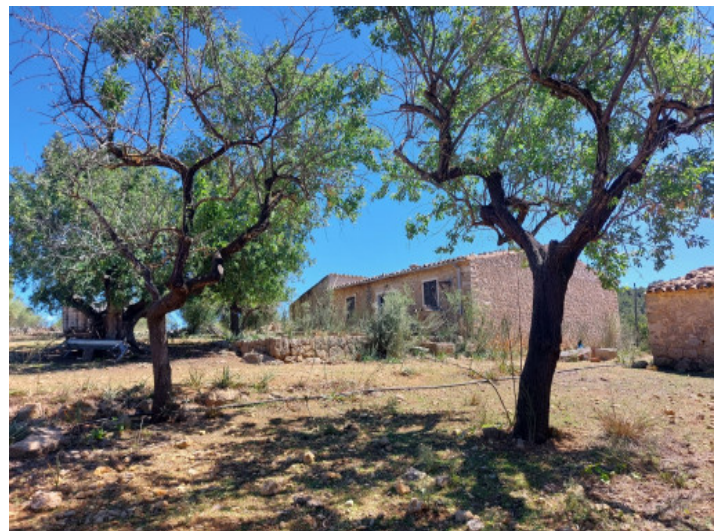
Terreno con project

Toda la información como mejor se puede saber, salvo por error durante el periodo de venta. Sirva este documento como un informe previo, las bases legales solo serán validas a traves de un contrato de compra acordado ante Notario.