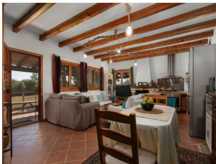
Salón-comedor y cocina