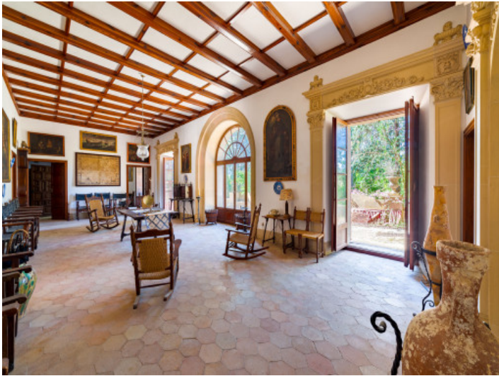
Gran propiedad en Establiments