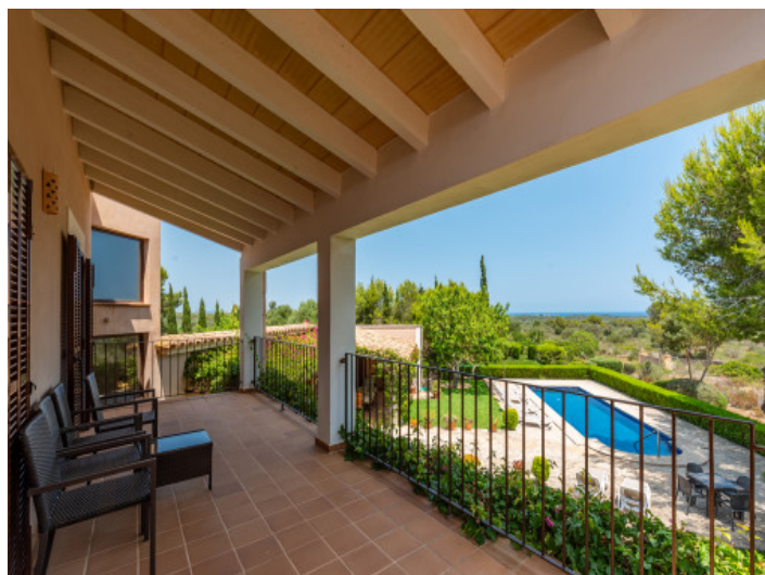
Balcón con vistas al mar

Toda la información como mejor se puede saber, salvo por error durante el periodo de venta. Sirva este documento como un informe previo, las bases legales solo serán válidas a través de un contrato de compra acordado ante Notario.