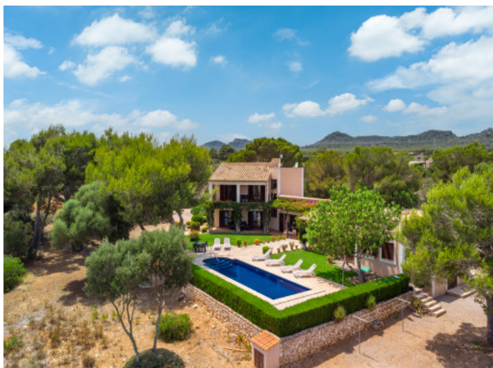
La finca a vista de pájaro