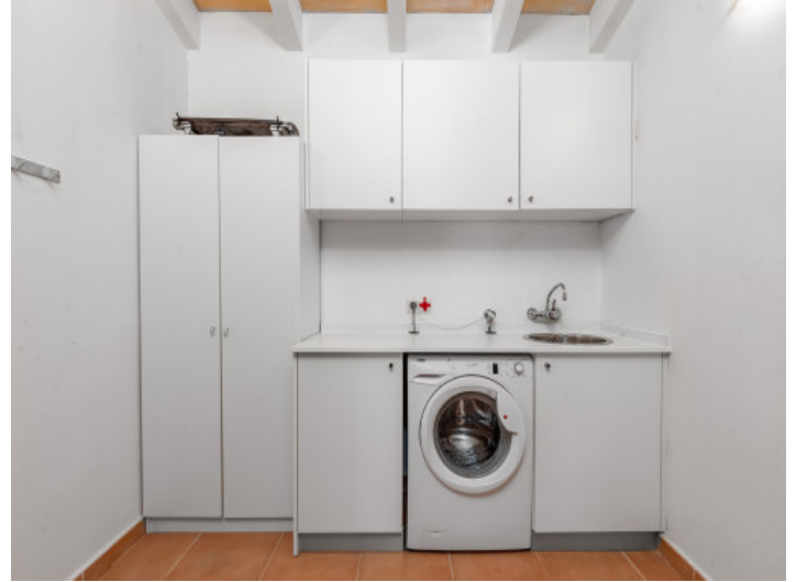
Cuarto de servicio