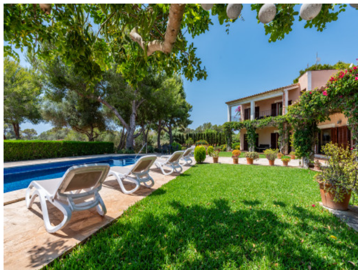
Jardín y piscina