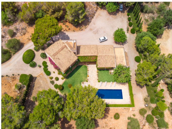
La finca a vista de pájaro