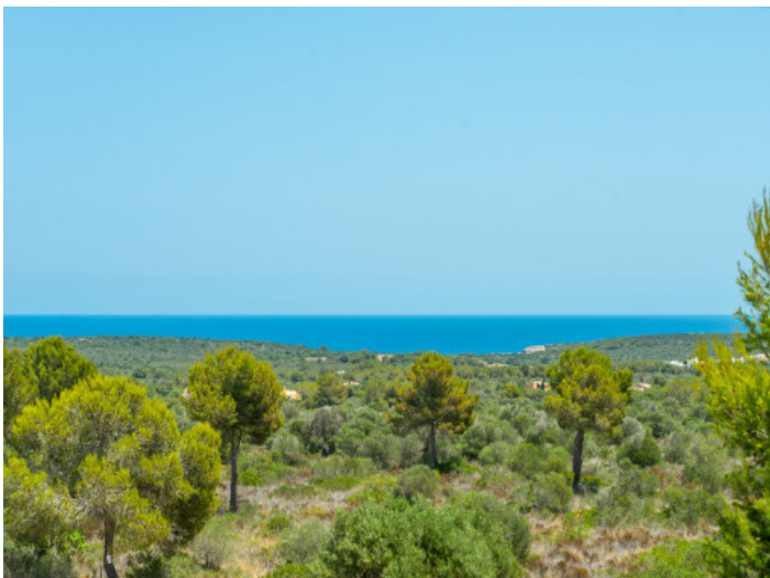
Vista al mar