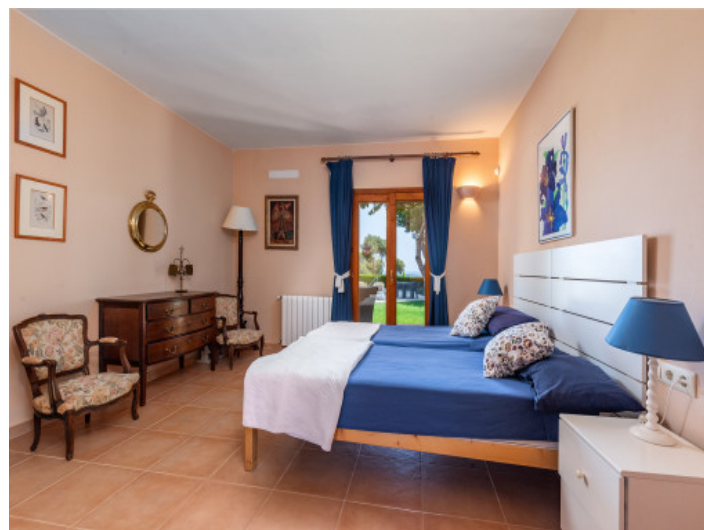
Uno de 4 dormitorios

Toda la información como mejor se puede saber, salvo por error durante el periodo de venta. Sirva este documento como un informe previo, las bases legales solo serán validas a traves de un contrato de compra acordado ante Notario.