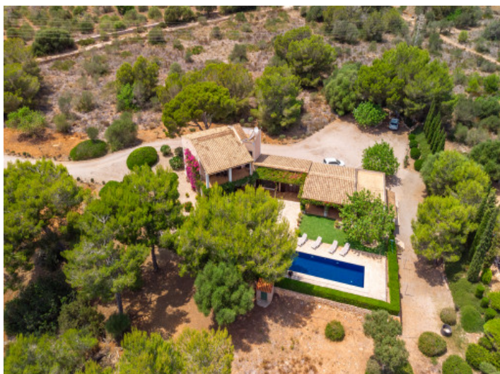
La finca a vista de pájaro