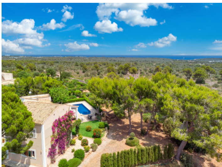
La finca a vista de pájaro