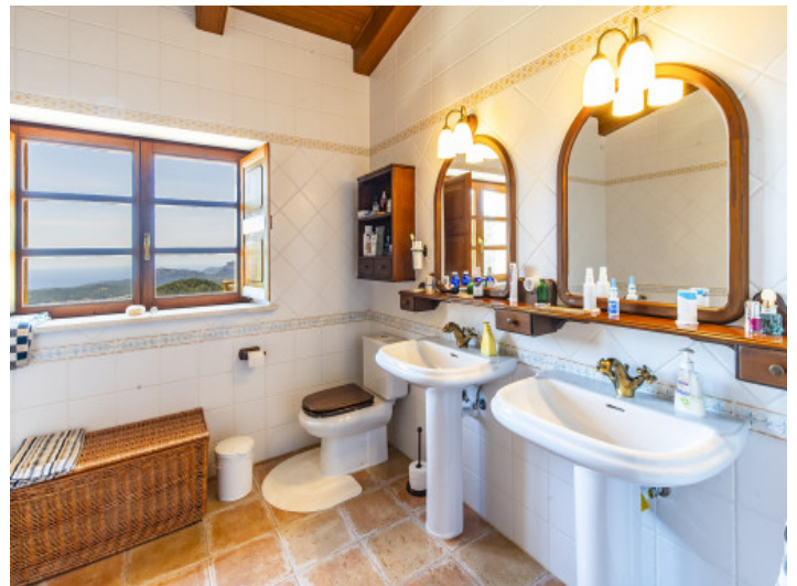
Uno de 5 baños