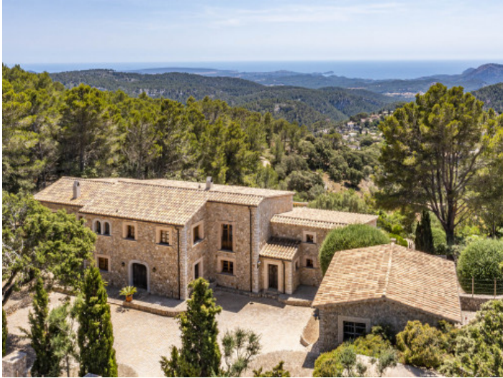
Vista exterior de la finca