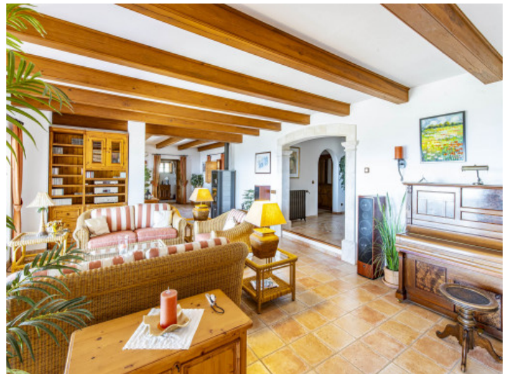
Vista alternativa al salón