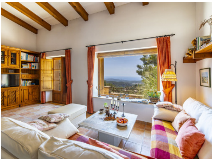
Salón con una vista