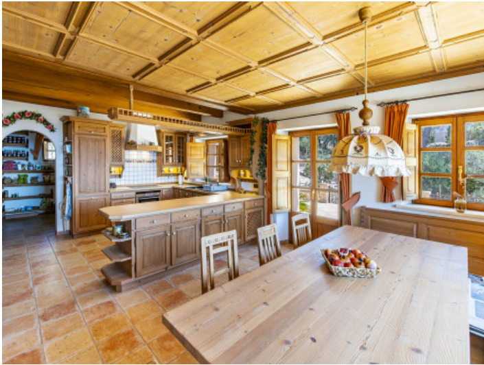
Cocina rústica con comedor