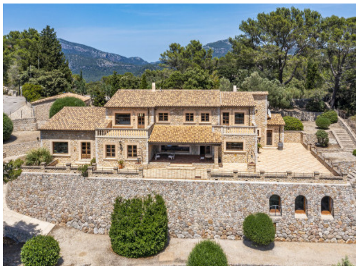
Vista exterior de la finca