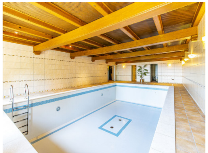
Piscina interior fantástica

Toda la información como mejor se puede saber, salvo por error durante el periodo de venta. Sirva este documento como un informe previo, las bases legales solo serán válidas a través de un contrato de compra acordado ante Notario.