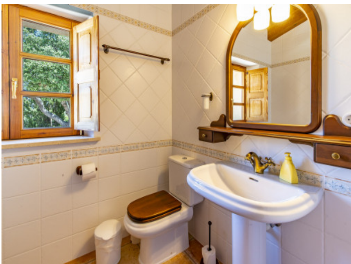
Uno de 5 baños