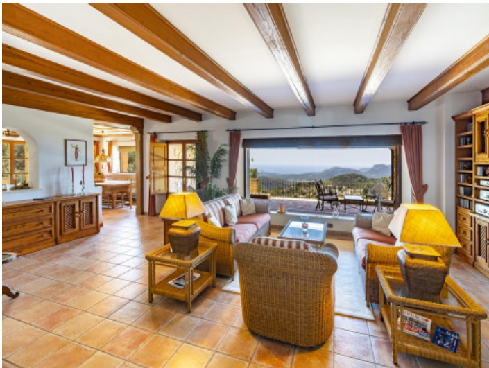
Salón con una vista