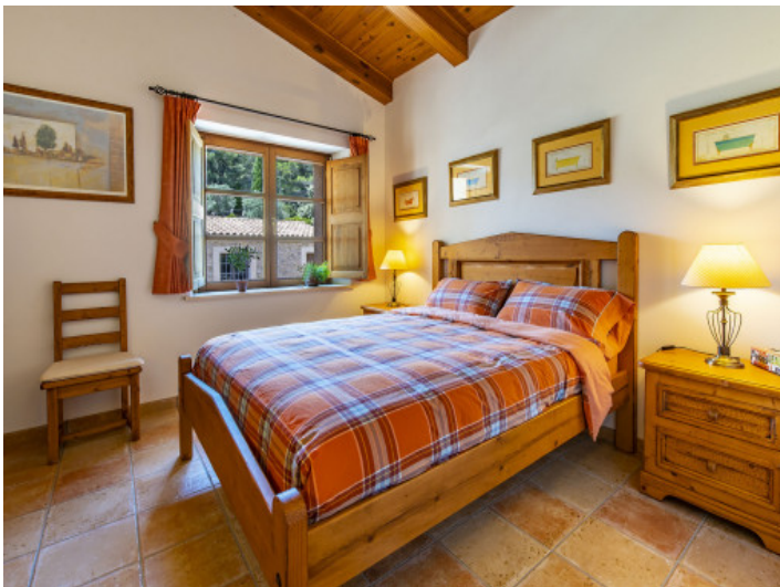
Uno de 4 dormitorios