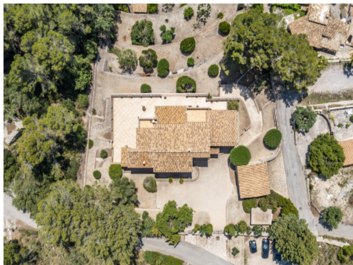
Vista exterior de la finca