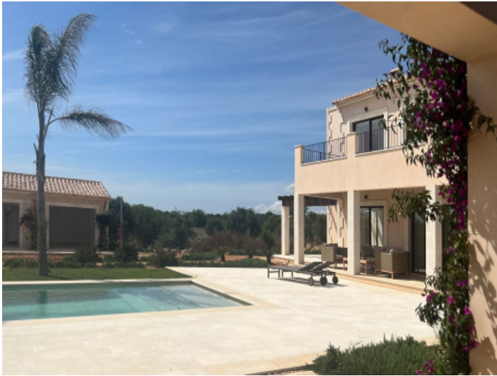
Finca y piscina