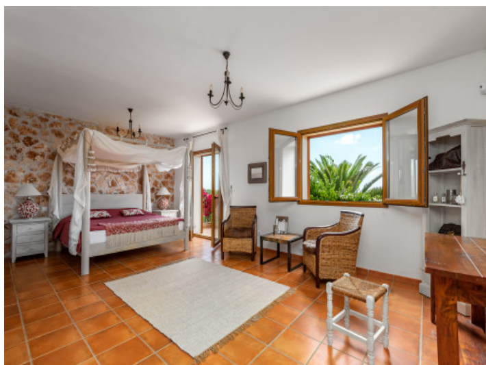
Uno de 5 dormitorios