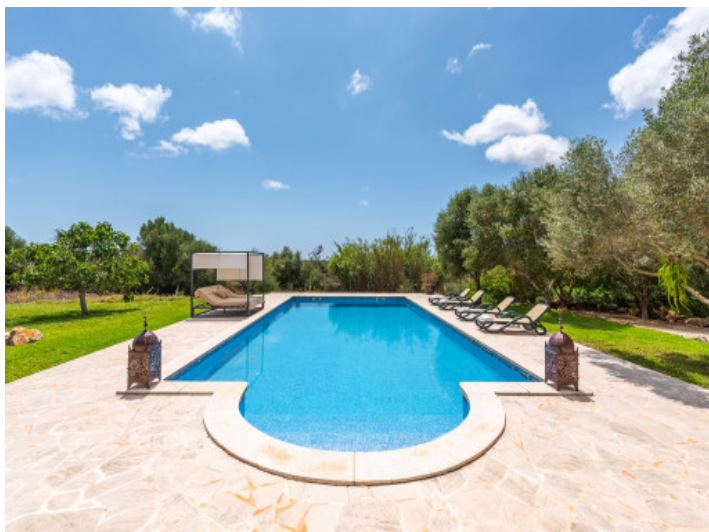
Zona de piscina bien cuidada