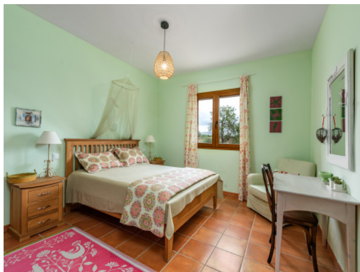
Uno de 5 dormitorios

Toda la información como mejor se puede saber, salvo por error durante el periodo de venta. Sirva este documento como un informe previo, las bases legales solo serán válidas a través de un contrato de compra acordado ante Notario.