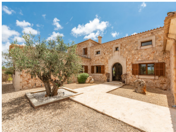
Fantástica finca con piscina, garaje y vistas a la naturaleza en Santanyi