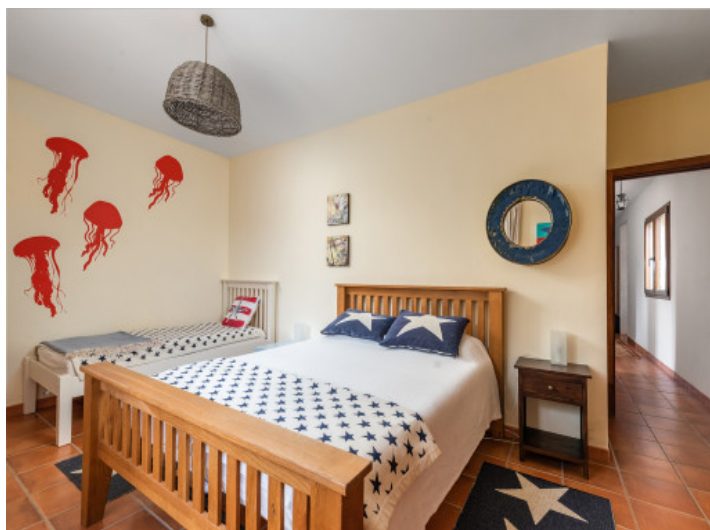
Uno de 5 dormitorios