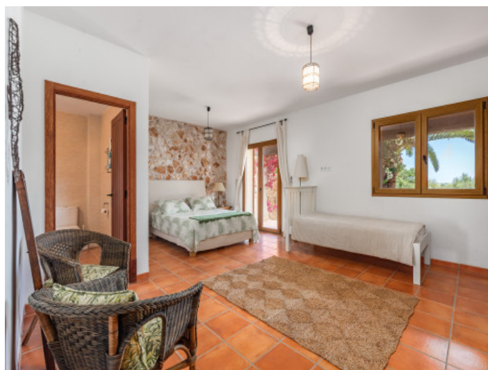
Uno de 5 dormitorios