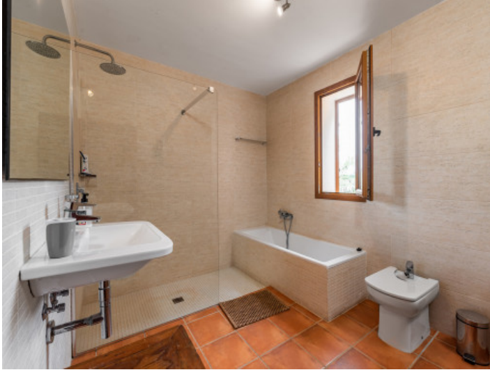
Uno de 4 baños