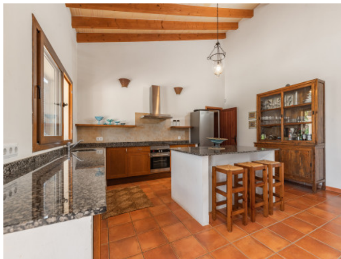
Cocina completamente equipada