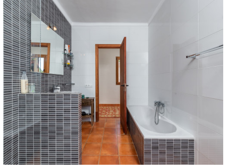
Uno de 4 baños