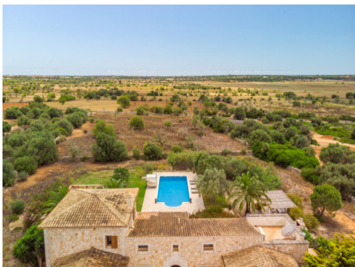
View from above