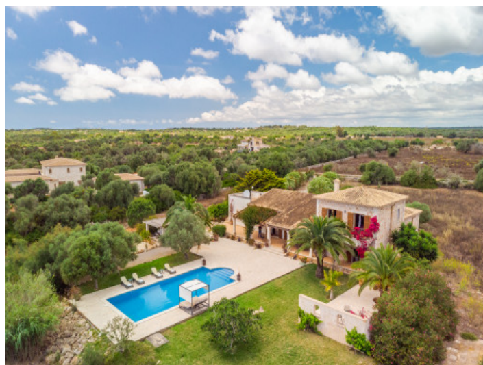
View from above