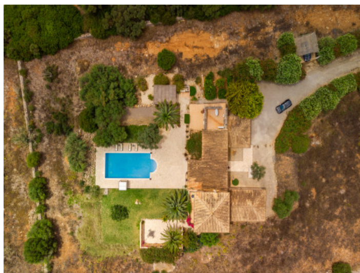
View from above