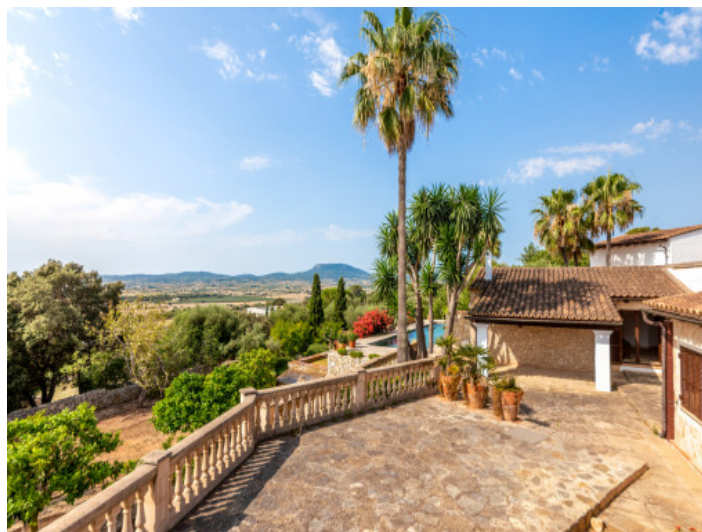
Vista al campo