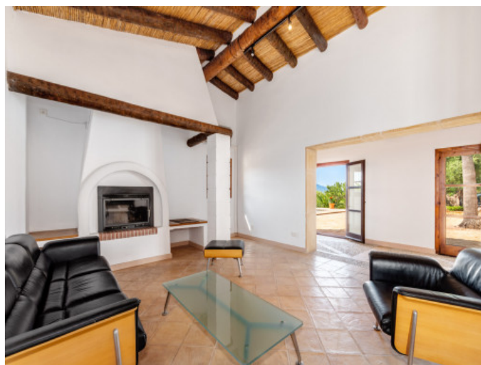
Salón con chimenea