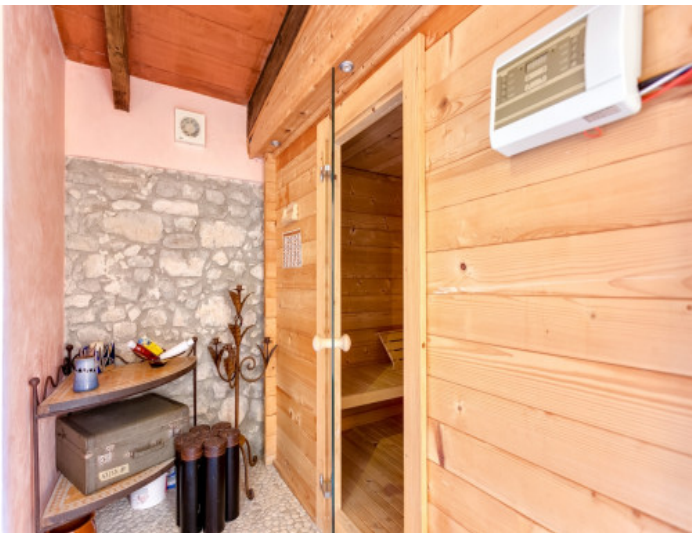
Spa con sauna