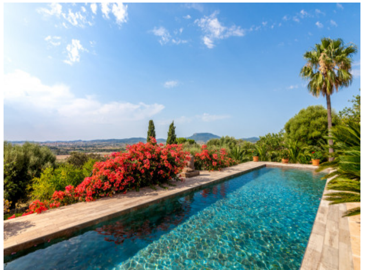
Piscina con vista