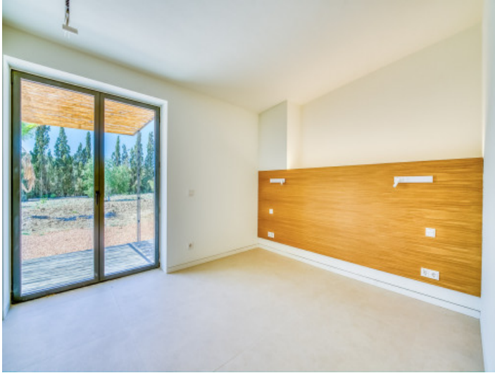
Uno de 5 dormitorios