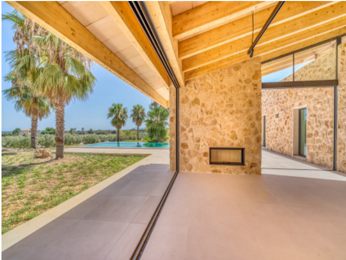
Puertas correderas panorámicas