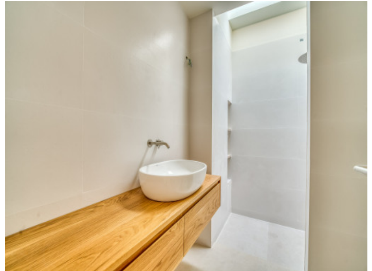
Uno de 5 baños