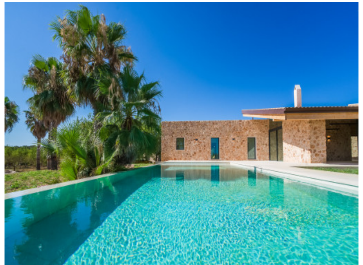
Fabulosa zona de piscina

Toda la información como mejor se puede saber, salvo por error durante el periodo de venta. Sirva este documento como un informe previo, las bases legales solo serán válidas a través de un contrato de compra acordado ante Notario.