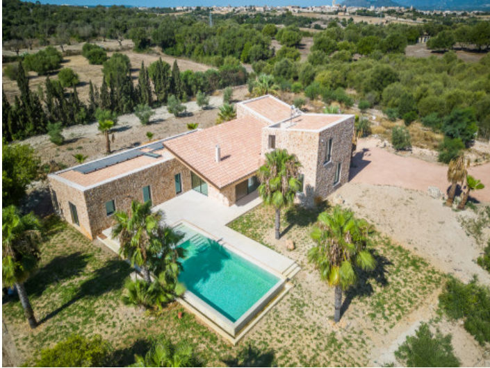
Vista desde arriba