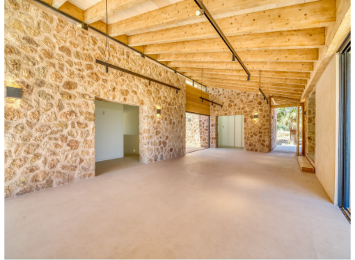
Salón-comedor con vigas vistas