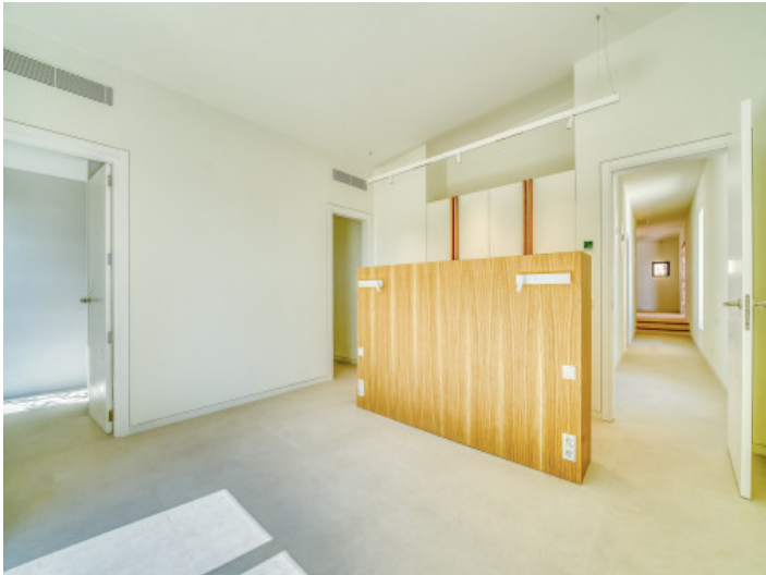
Uno de 5 dormitorios