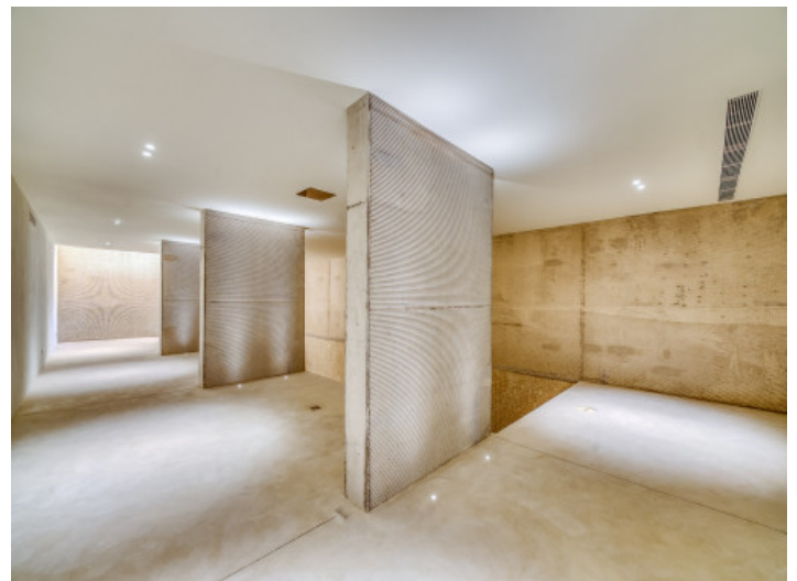
Ducha junto a la piscina interior

Toda la información como mejor se puede saber, salvo por error durante el periodo de venta. Sirva este documento como un informe previo, las bases legales solo serán válidas a través de un contrato de compra acordado ante Notario.