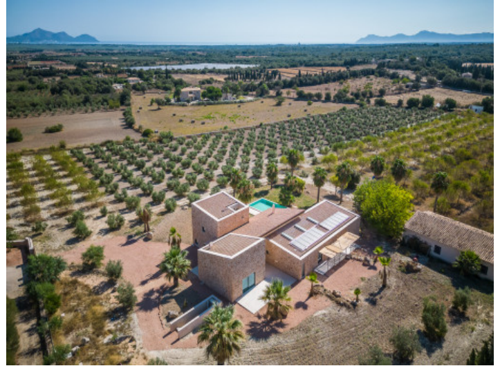
Vista de pájaro