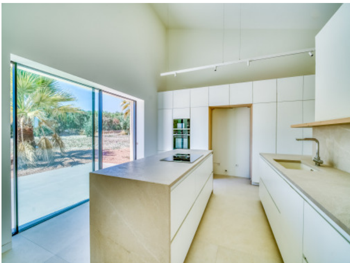
Cocina con salida a una terraza