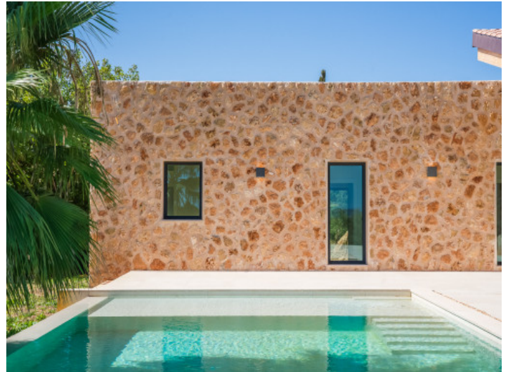
Fachada de piedra natural