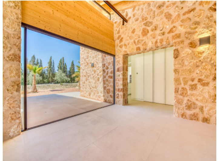
Puerta corredera con vistas al jardín