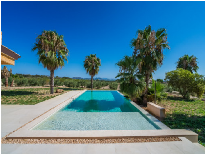
Piscina con vistas a la bahía de Alcúdia