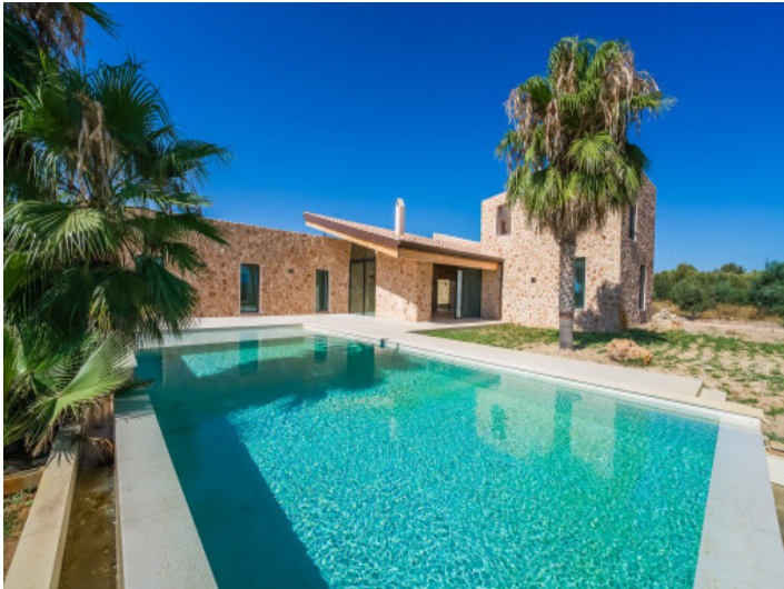
Piscina muy grande