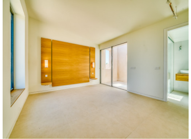
Uno de 5 dormitorios