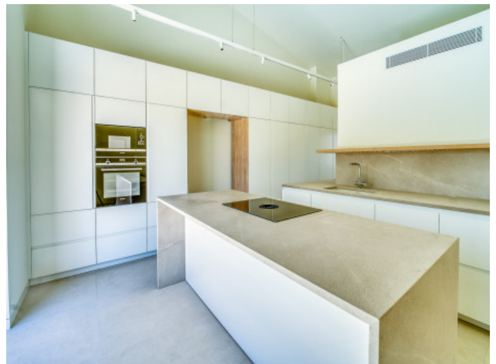
Moderna cocina equipada

Toda la información como mejor se puede saber, salvo por error durante el periodo de venta. Sirva este documento como un informe previo, las bases legales solo serán válidas a través de un contrato de compra acordado ante Notario.