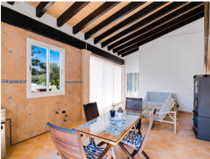
Casa para los invitados