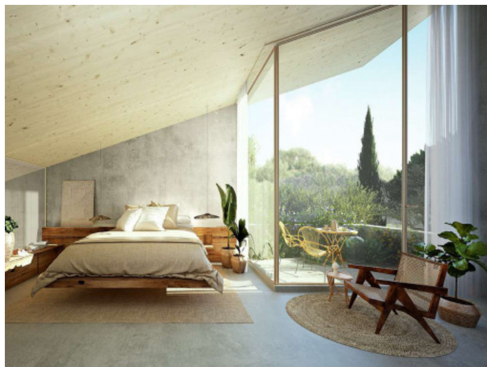
Grandes ventanales en el dormitorio principal de la planta superior