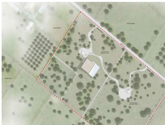
Distribución de los edificios en la parcela

Toda la información como mejor se puede saber, salvo por error durante el periodo de venta. Sirva este documento como un informe previo, las bases legales solo serán validas a traves de un contrato de compra acordado ante Notario.