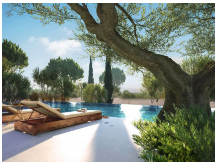
Ambiente de oasis. alrededor de la piscina