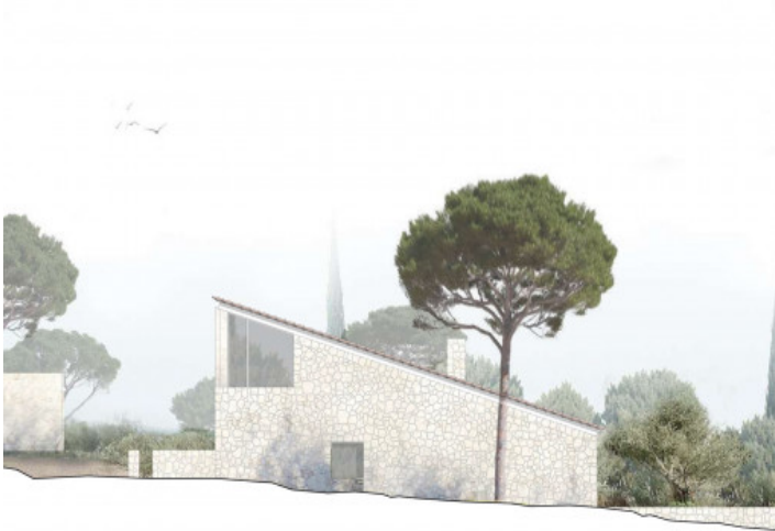
Vista del estudio de la arquitectura