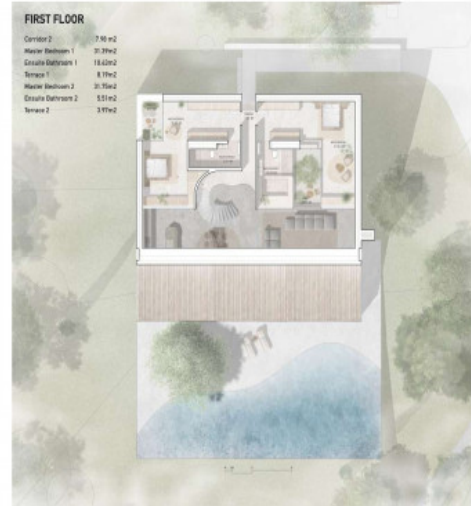
Plano de la planta superior