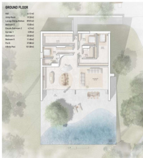
Plano de la planta baja