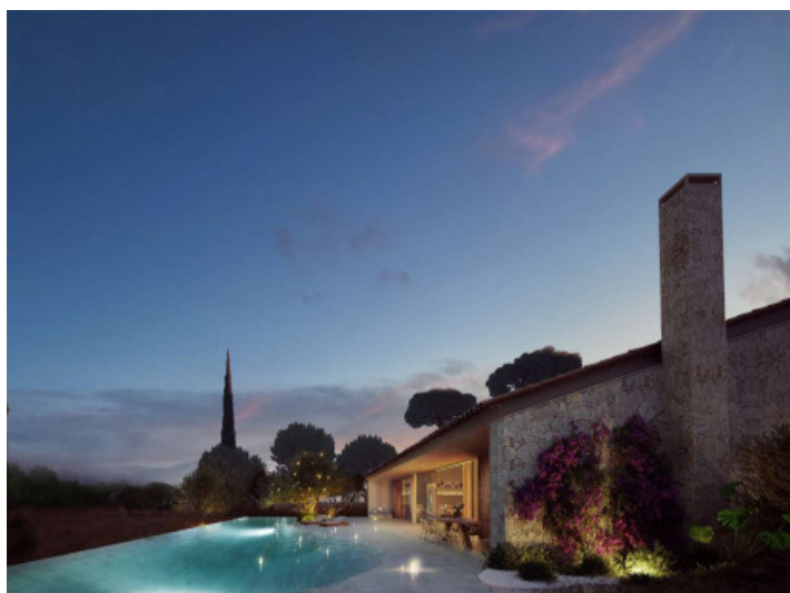
Iluminación sofisticada de noche