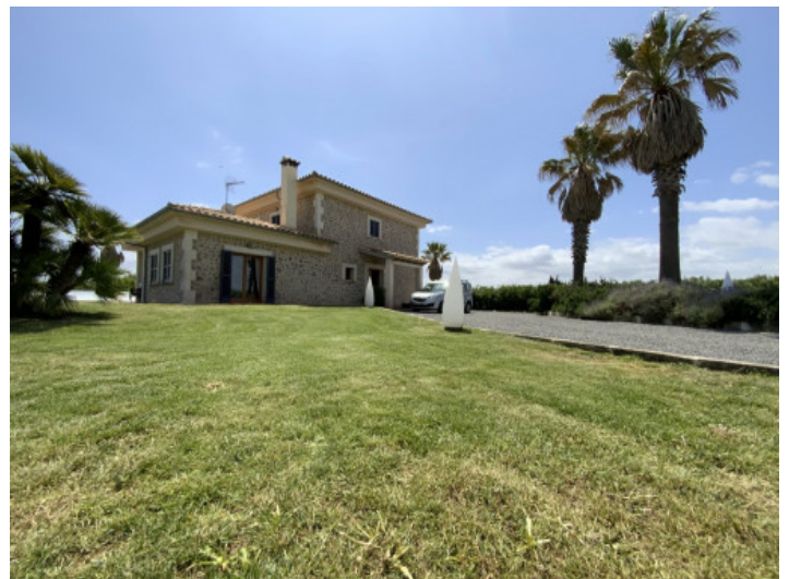
Finca y jardín

Toda la información como mejor se puede saber, salvo por error durante el periodo de venta. Sirva este documento como un informe previo, las bases legales solo serán válidas a través de un contrato de compra acordado ante Notario.