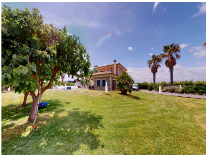
Finca de piedra natural con piscina y plantación de olivos cerca de la playa