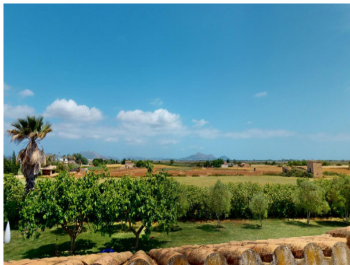
Vistas al paisaje