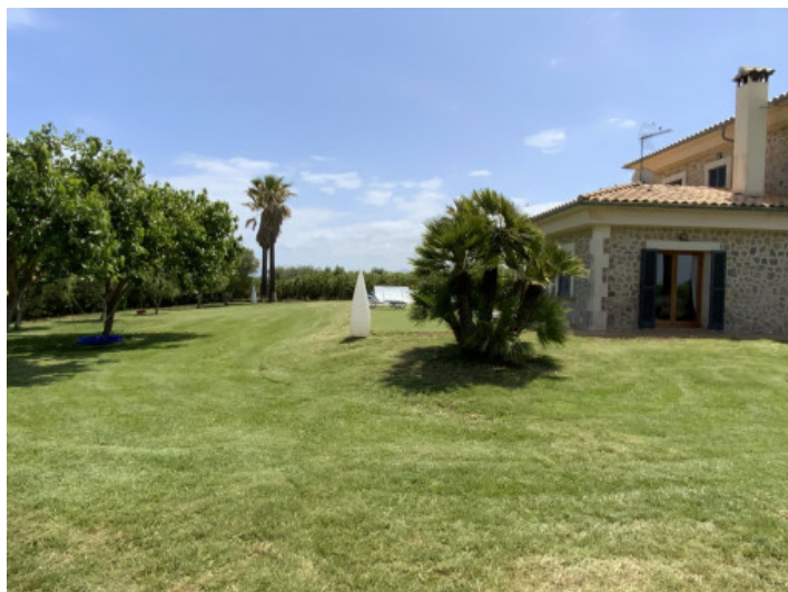
Finca y jardín