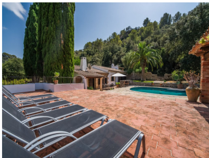
Zona de piscina

Toda la información como mejor se puede saber, salvo por error durante el periodo de venta. Sirva este documento como un informe previo, las bases legales solo serán válidas a través de un contrato de compra acordado ante Notario.