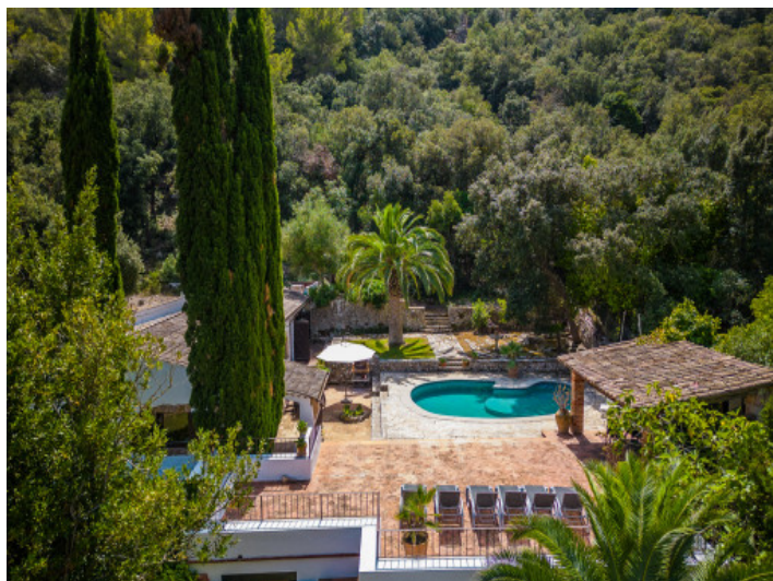
Zona de piscina