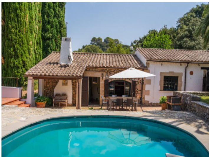
Finca y piscina