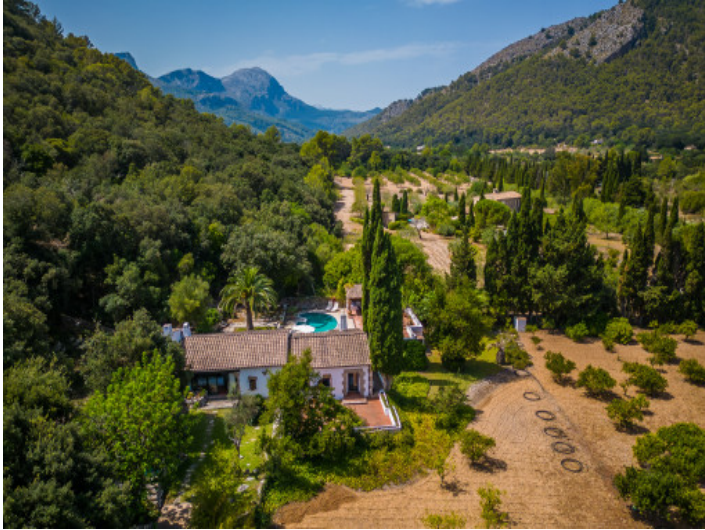
Vista desde arriba