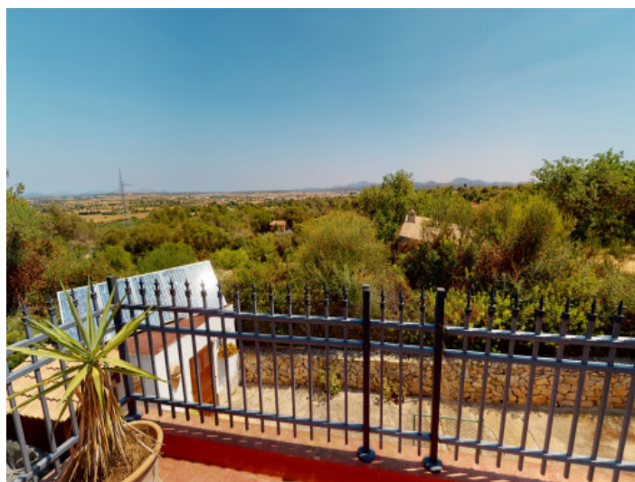
Balcón con una vista