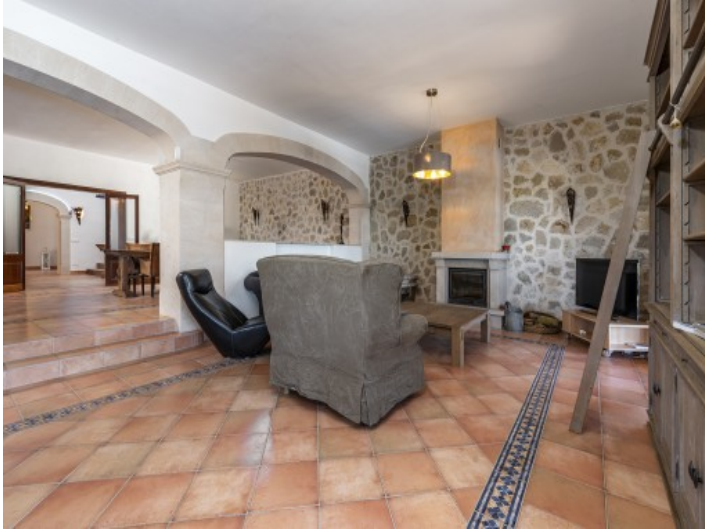
Salón con chimenea