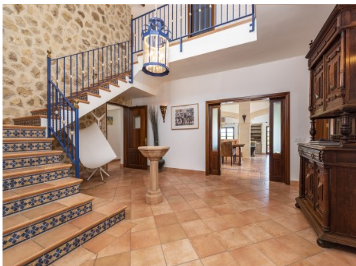
Entrada de la finca