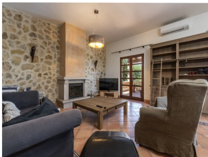
Salón con chimenea

Toda la información como mejor se puede saber, salvo por error durante el periodo de venta. Sirva este documento como un informe previo, las bases legales solo serán válidas a través de un contrato de compra acordado ante Notario.