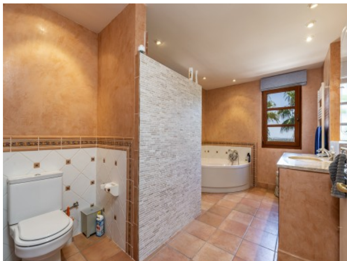
Baño con bañera