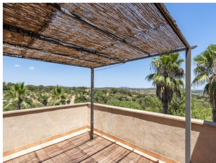
Balcón con vista