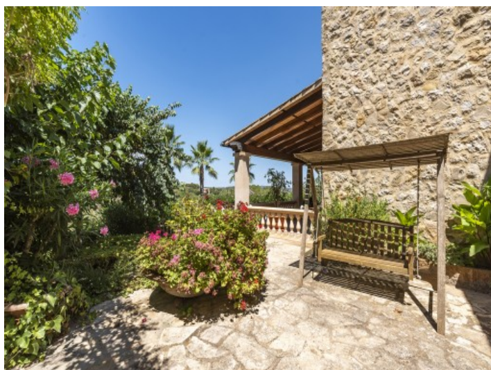
Zona de estar