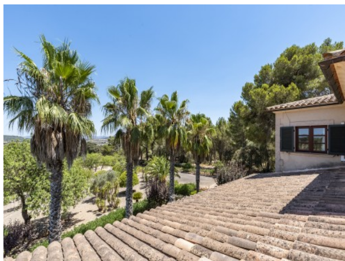
Vista desde el balcón