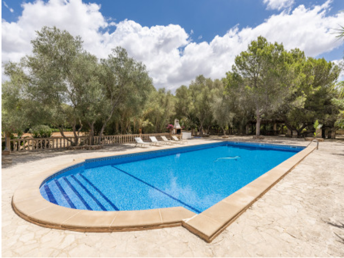
Piscina con barbacoa