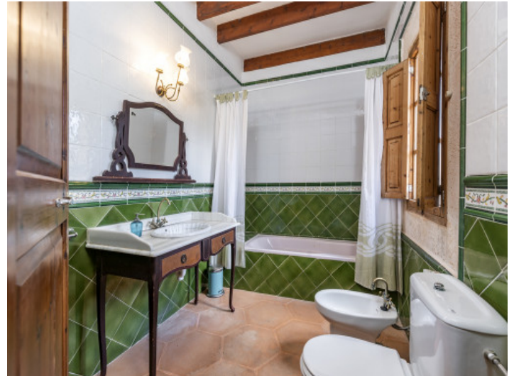
Uno de los 4 dormitorios