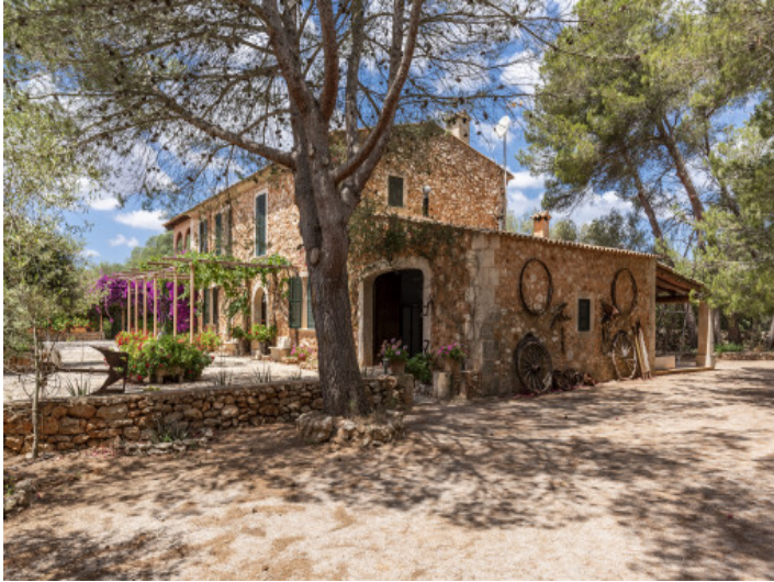
Vista exterior de la finca