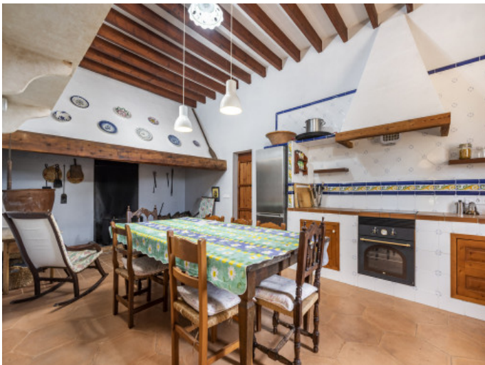
Cocina con zona de desayuno