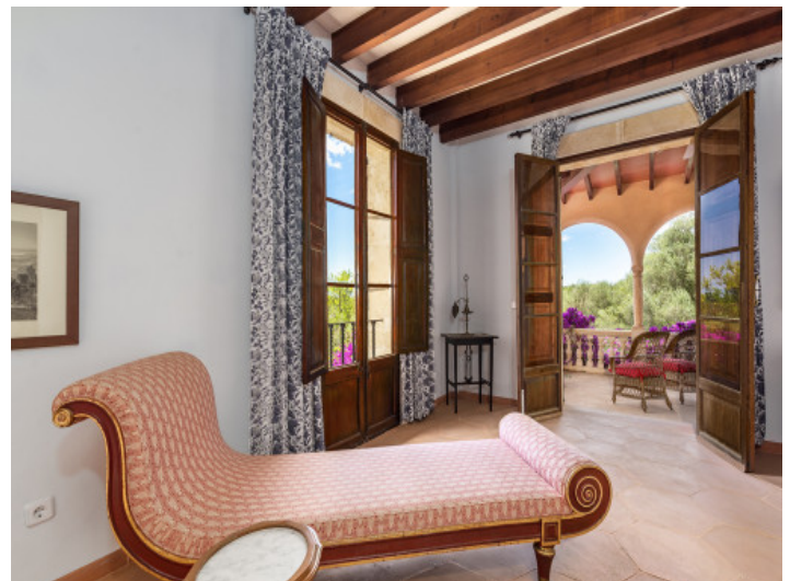
One bedroom has access to a private terrace

Toda la información como mejor se puede saber, salvo por error durante el periodo de venta. Sirva este documento como un informe previo, las bases legales solo serán válidas a través de un contrato de compra acordado ante Notario.