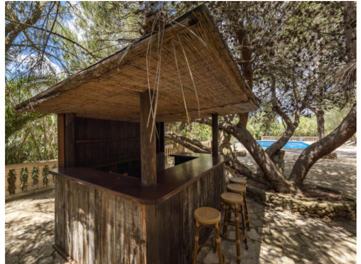
Bar junto a la piscina