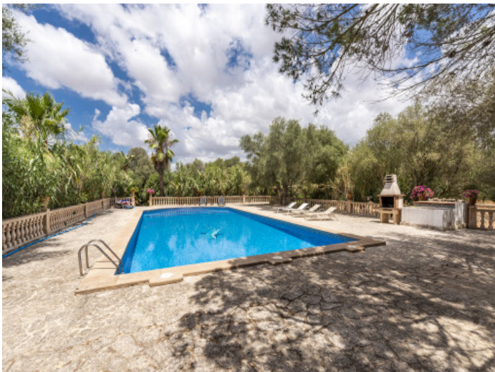
Espaciosa zona de piscina