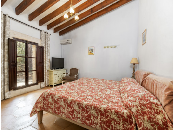
Uno de los 5 dormitorios