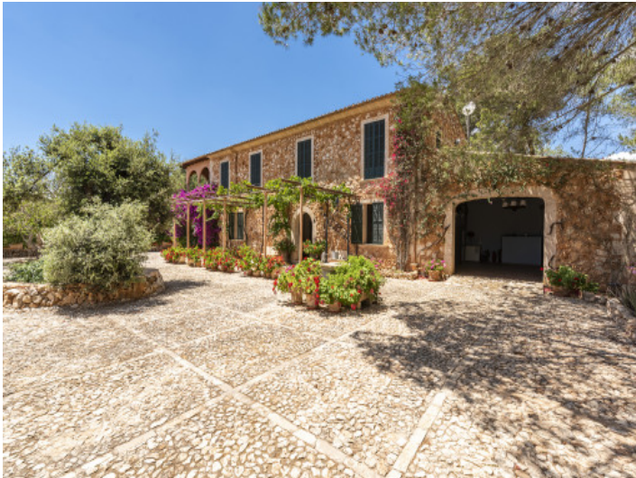
Romántica finca con garaje