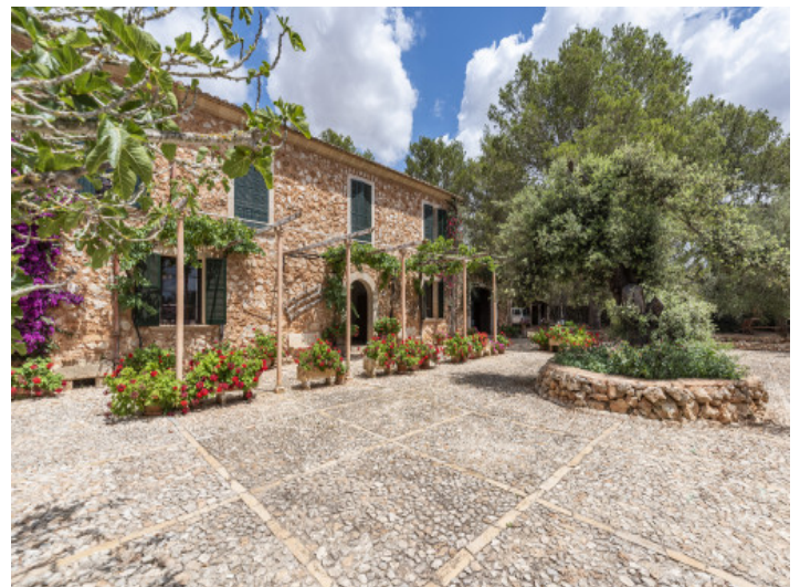
Fachada vestida de piedra natural

Toda la información como mejor se puede saber, salvo por error durante el periodo de venta. Sirva este documento como un informe previo, las bases legales solo serán válidas a través de un contrato de compra acordado ante Notario.