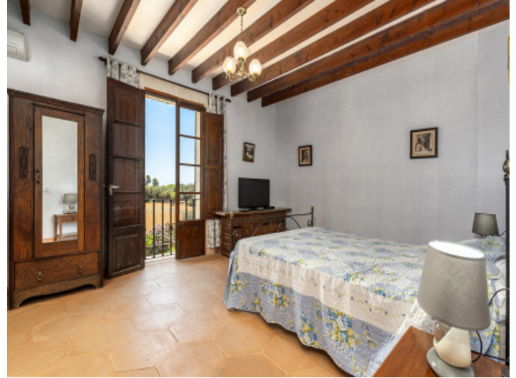
Uno de los 5 dormitorios