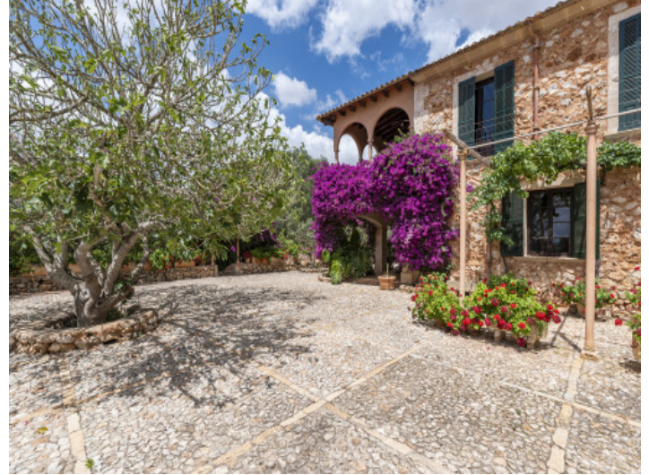
Vista exterior de la finca