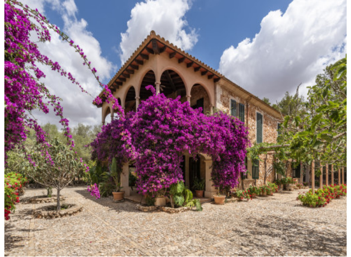
Vista exterior de la finca