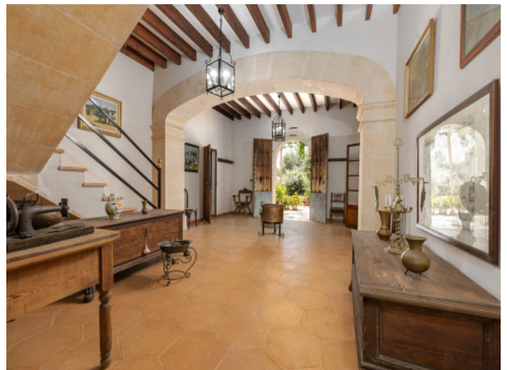
Amplia zona de entrada

Toda la información como mejor se puede saber, salvo por error durante el periodo de venta. Sirva este documento como un informe previo, las bases legales solo serán válidas a través de un contrato de compra acordado ante Notario.