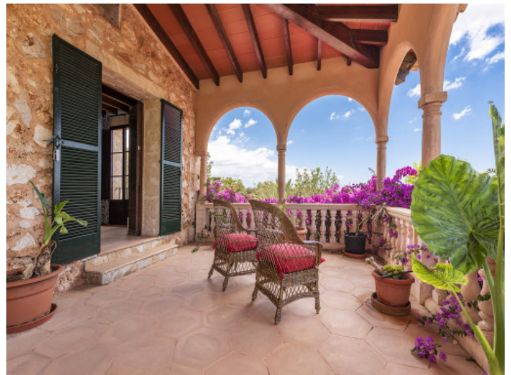
Espaciosa terraza cubierta