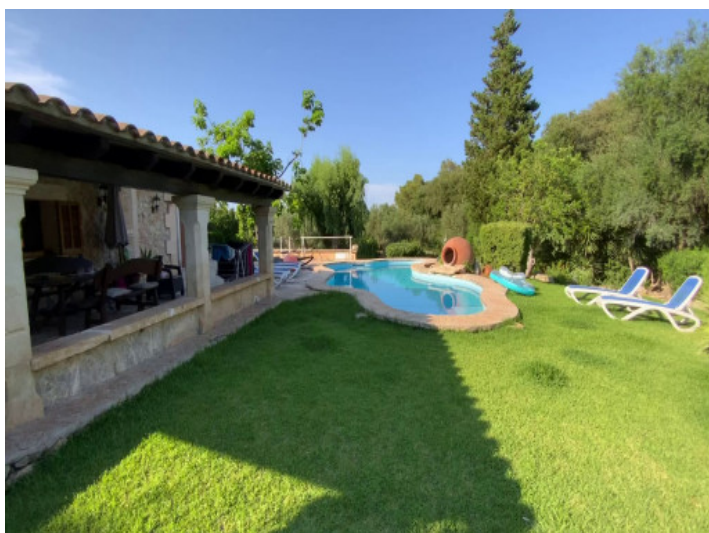
Jardin y piscina