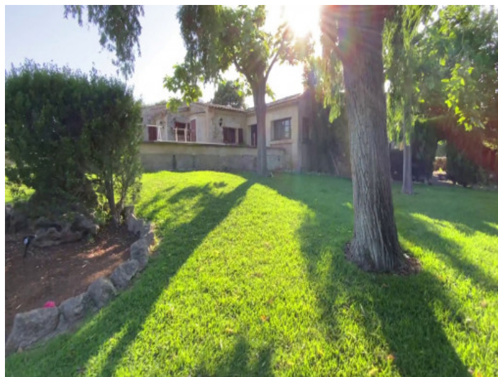
Vistas a la finca