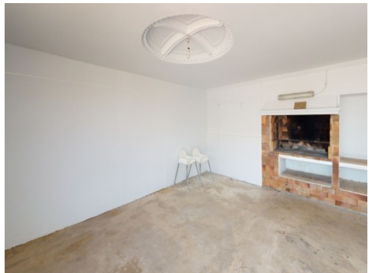
Área de barbacoa

Toda la información como mejor se puede saber, salvo por error durante el periodo de venta. Sirva este documento como un informe previo, las bases legales solo serán válidas a través de un contrato de compra acordado ante Notario.