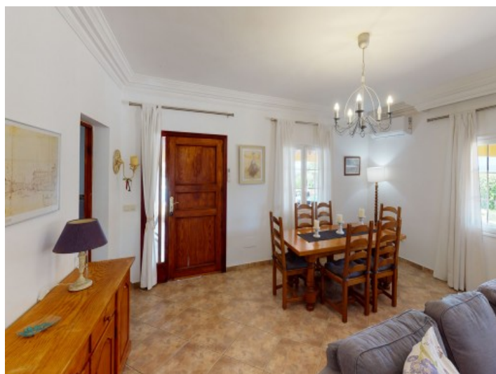
Comedor y entrada