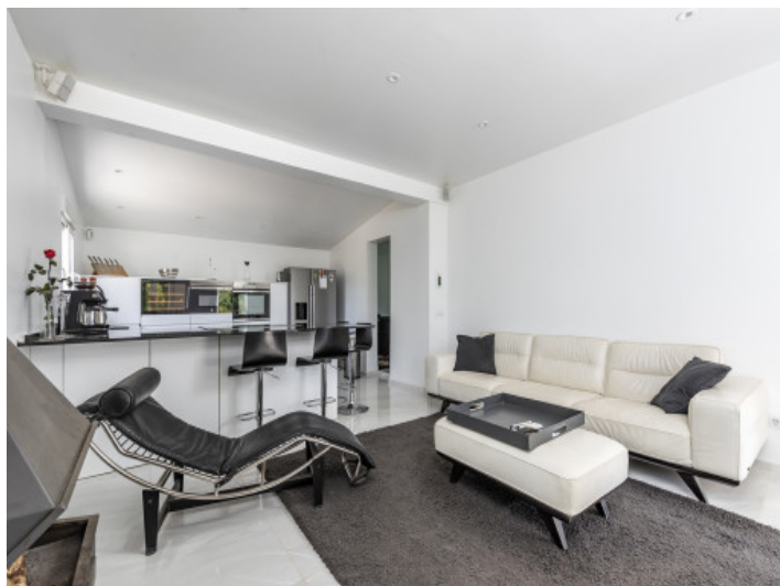
Salón y cocina