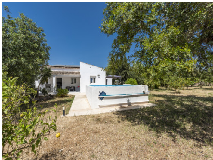
Vista exterior y piscina