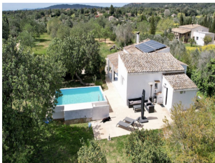
Vista desde arriba