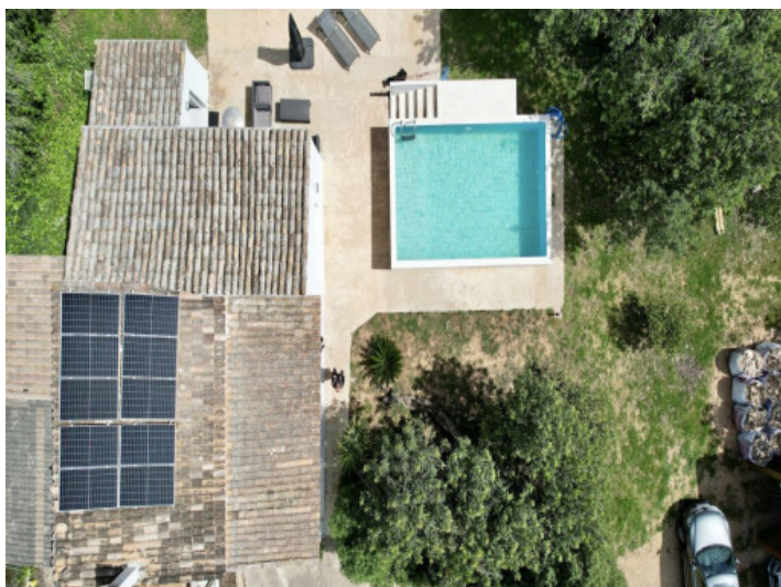
Vista desde arriba