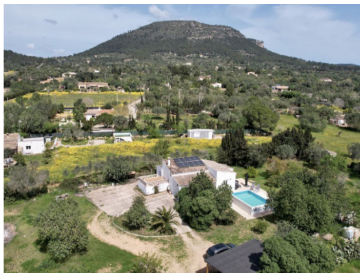
Vista desde arriba

Toda la información como mejor se puede saber, salvo por error durante el periodo de venta. Sirva este documento como un informe previo, las bases legales solo serán validas a traves de un contrato de compra acordado ante Notario.