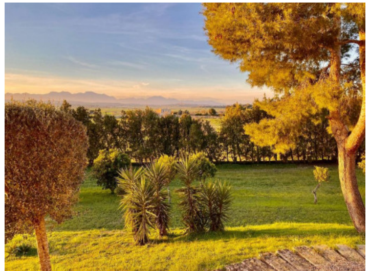
Vista idílica al paisaje

Toda la información como mejor se puede saber, salvo por error durante el periodo de venta. Sirva este documento como un informe previo, las bases legales solo serán válidas a través de un contrato de compra acordado ante Notario.