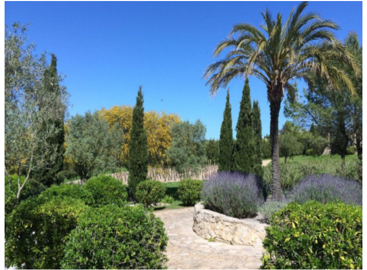
Vista al jardín