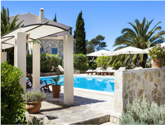
Vista alternativa a la piscina