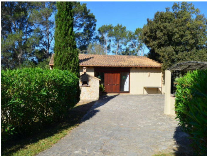
Vista al jardín