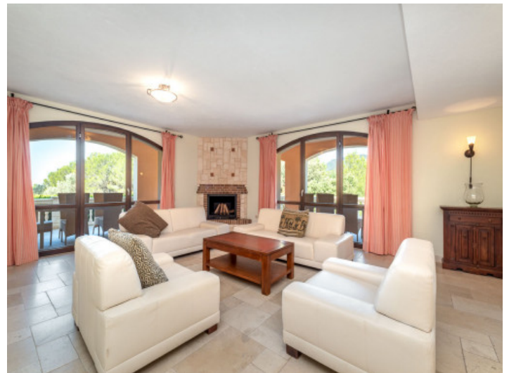
Área de estar