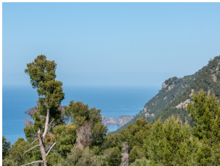
Vistas panorámicas al mar