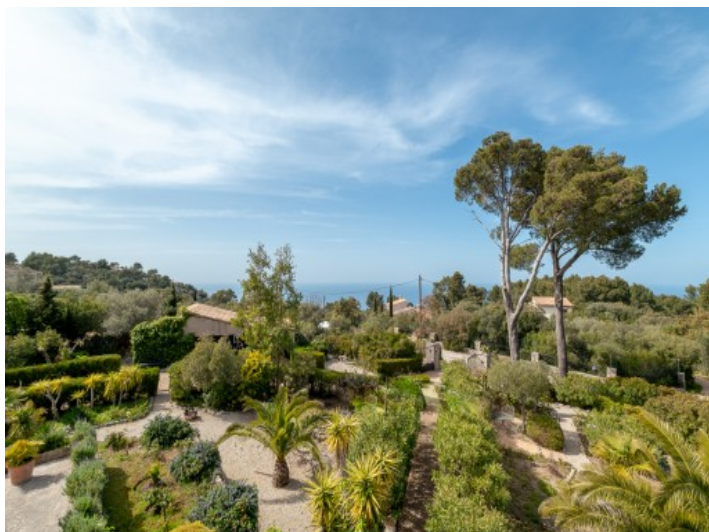
Vistas sobre el terreno