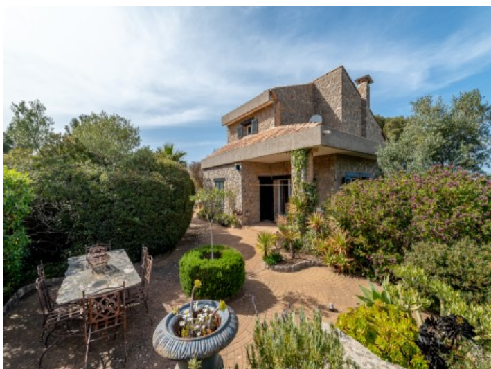
Terraza en el jardín