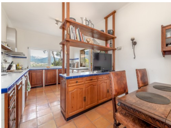
Cocina y comedor