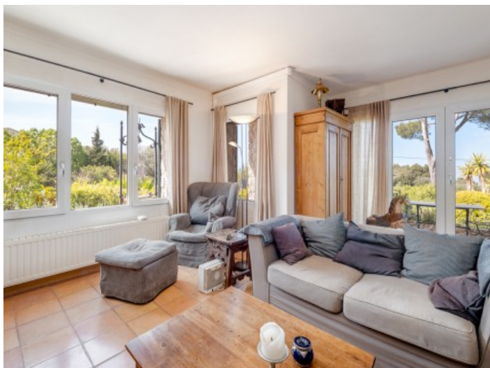
Área de estar