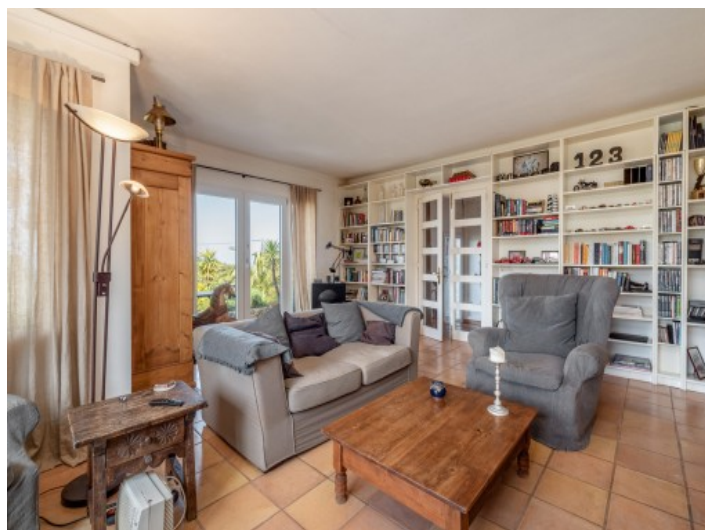
Área de estar

Toda la información como mejor se puede saber, salvo por error durante el periodo de venta. Sirva este documento como un informe previo, las bases legales solo serán válidas a través de un contrato de compra acordado ante Notario.