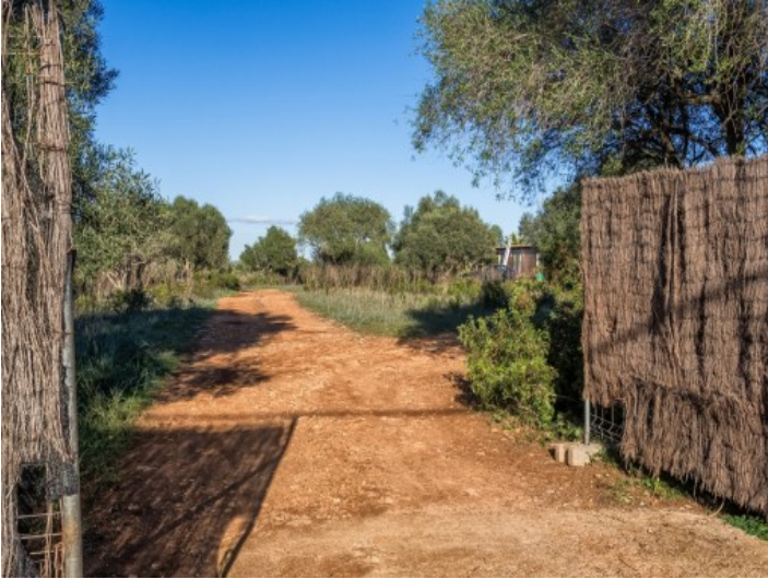
Entrada al solar