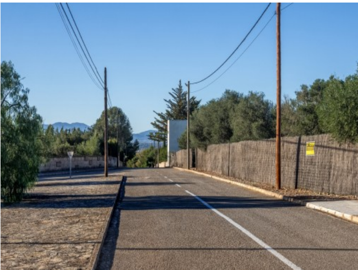
Está a 15 minutos de Palma