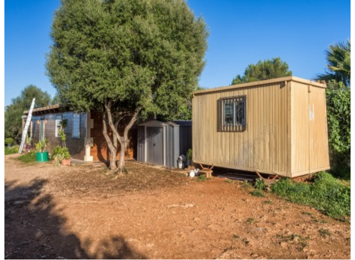
Se prevé construir una finca de piedra de 2 plantas