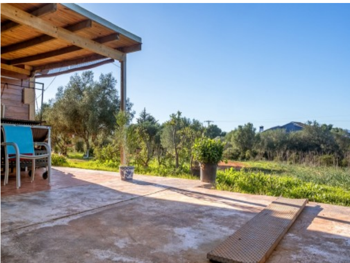
La finca tendrá un área de estar de 60 metros cuadrados