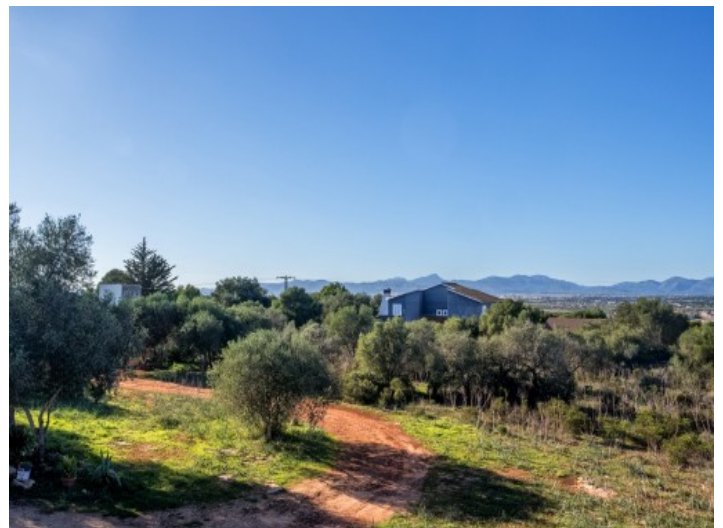
El solar es fácilmente accesible a través de una calle asfaltada

Toda la información como mejor se puede saber, salvo por error durante el periodo de venta. Sirva este documento como un informe previo, las bases legales solo serán válidas a través de un contrato de compra acordado ante Notario.