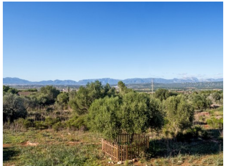
Vistas idílicas de la Tramuntana