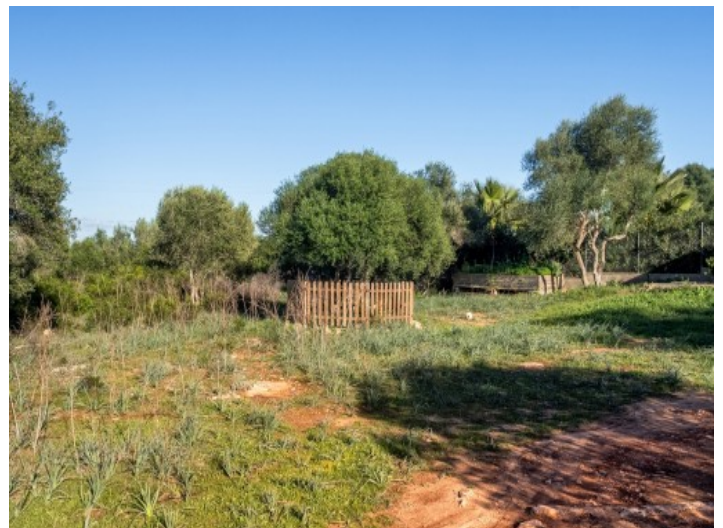
Un jardín bonito puede ser plantado

Toda la información como mejor se puede saber, salvo por error durante el periodo de venta. Sirva este documento como un informe previo, las bases legales solo serán válidas a través de un contrato de compra acordado ante Notario.