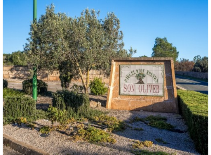
El solar está situada en un área rural