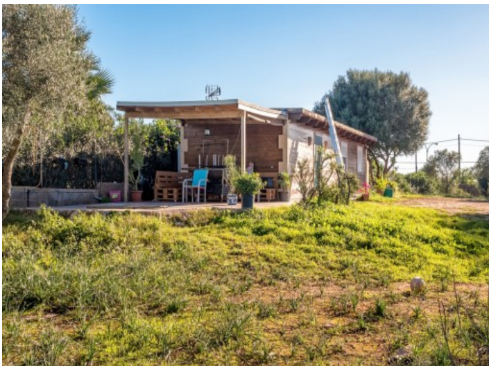
La superficie construida será 407 metros cuadrados