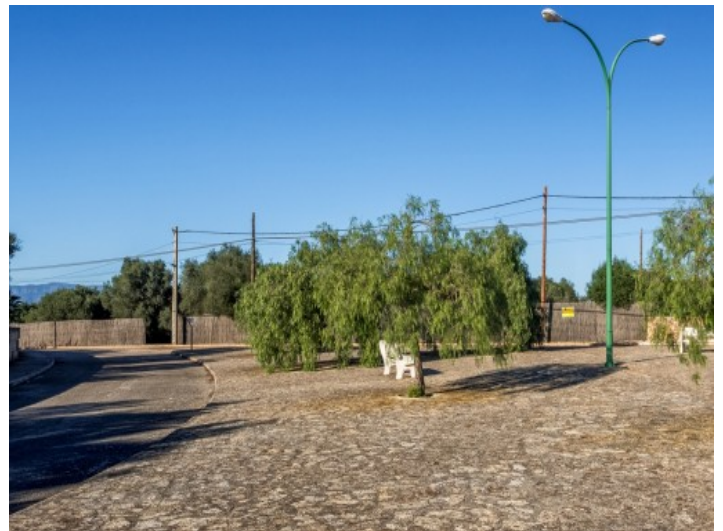
La urbanización está cerca del aeropuerto