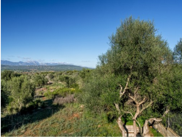
Fantásticas vistas panorámicas