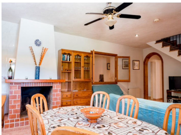
Comedor con chimenea