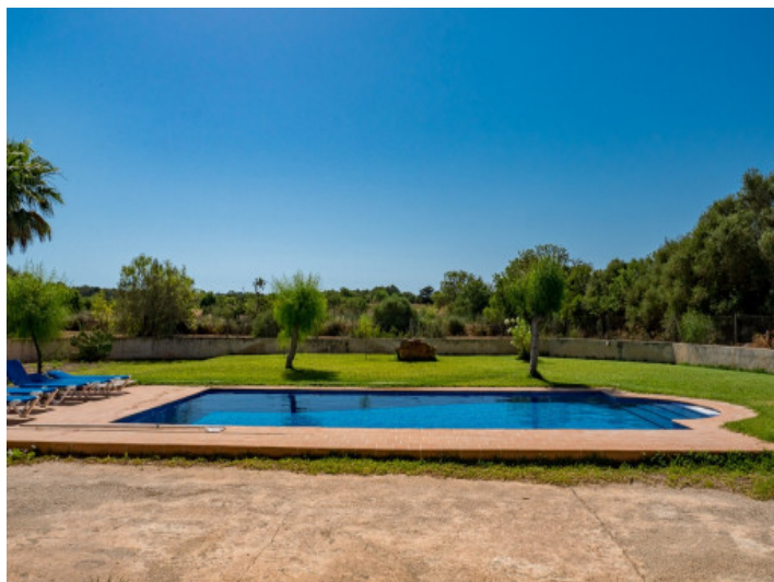
Vistas desde la finca a la piscina y el jardín