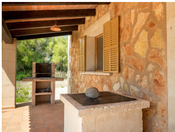
Terraza cubierta con barbacoa

Toda la información como mejor se puede saber, salvo por error durante el periodo de venta. Sirva este documento como un informe previo, las bases legales solo serán válidas a través de un contrato de compra acordado ante Notario.