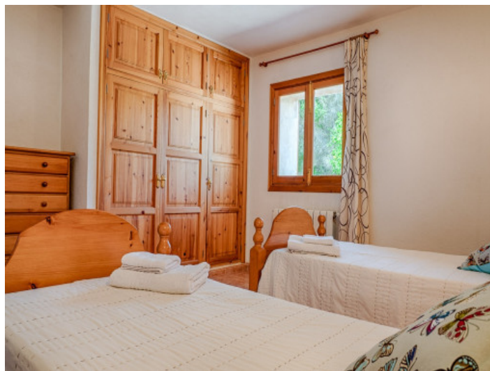
Dormitorio con dos camas