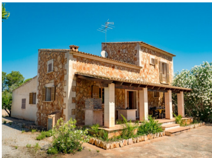
Vistas a la finca