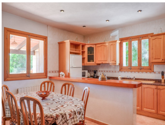
Cocina abierta con comedor

Toda la información como mejor se puede saber, salvo por error durante el periodo de venta. Sirva este documento como un informe previo, las bases legales solo serán válidas a través de un contrato de compra acordado ante Notario.