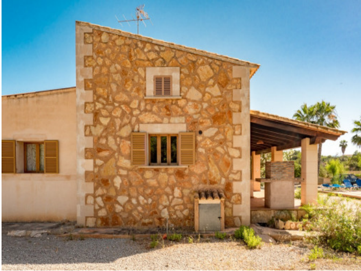
Finca con piedras natural