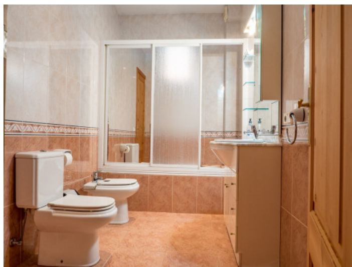
Baño con bañera