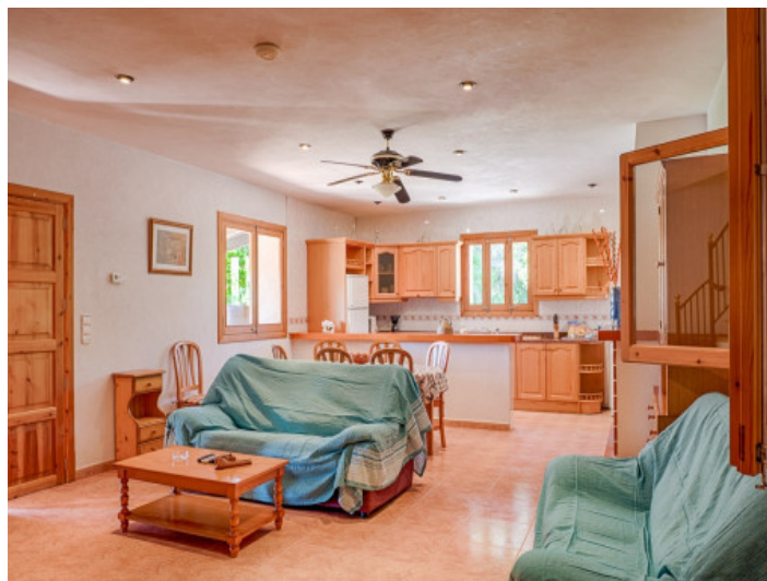
Salón inundado de luz