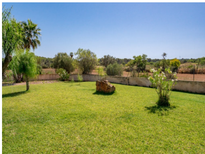
Jardín bien cuidado

Toda la información como mejor se puede saber, salvo por error durante el periodo de venta. Sirva este documento como un informe previo, las bases legales solo serán validas a traves de un contrato de compra acordado ante Notario.