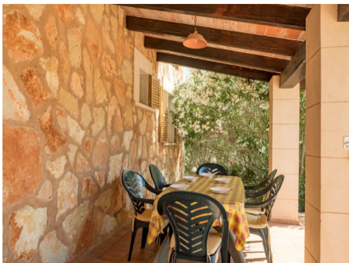
Comedor en la terraza