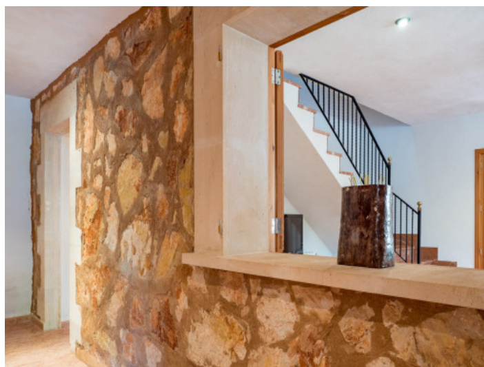
Vistas al corredor de la finca