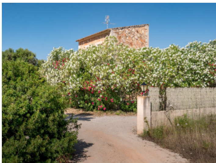
Acceso a la finca