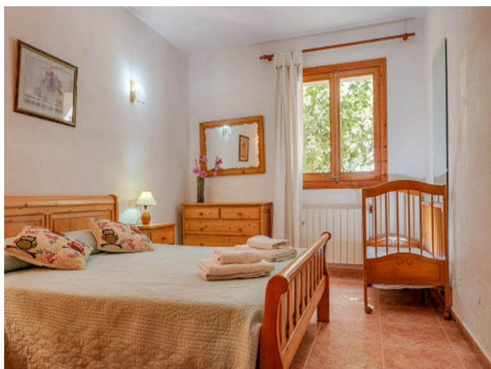
Dormitorio con calefacción