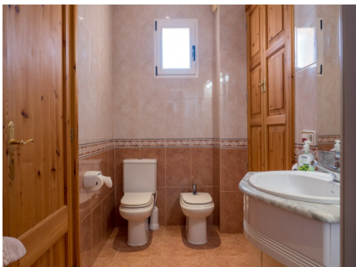
Baño con luz natural