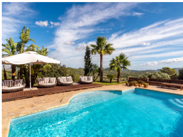
Zona de piscina

Toda la información como mejor se puede saber, salvo por error durante el periodo de venta. Sirva este documento como un informe previo, las bases legales solo serán válidas a través de un contrato de compra acordado ante Notario.