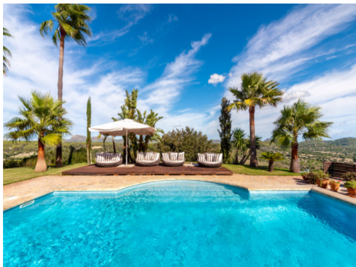
Zona de piscina