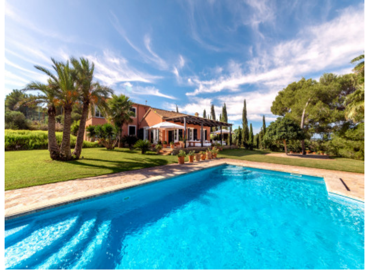
Zona de piscina