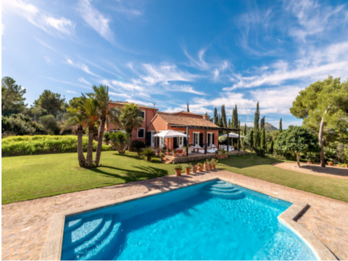
Zona de piscina