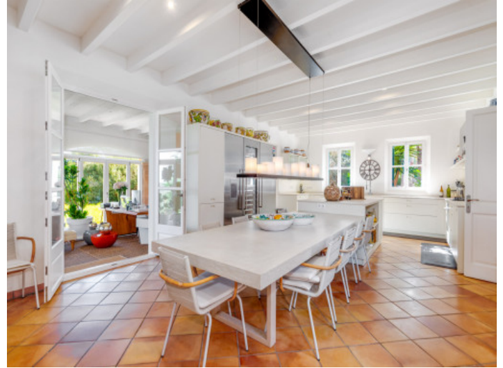
Cocina y estudio