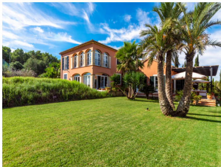
Jardín y finca