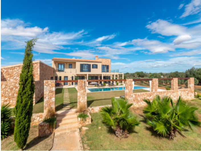
Moderna finca con piscina y vistas lejanas en los límites de Ses Salines