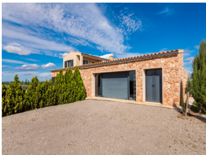
Garaje y parking exterior