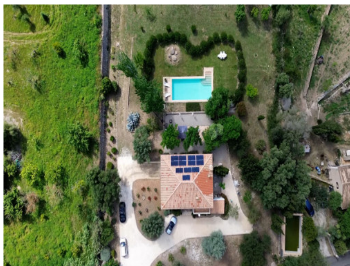
Vistas al pajar