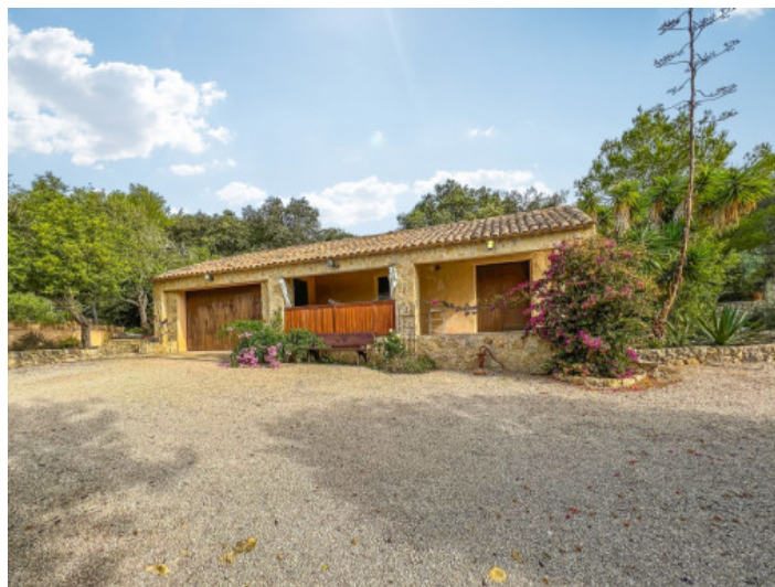
Garaje y trastero