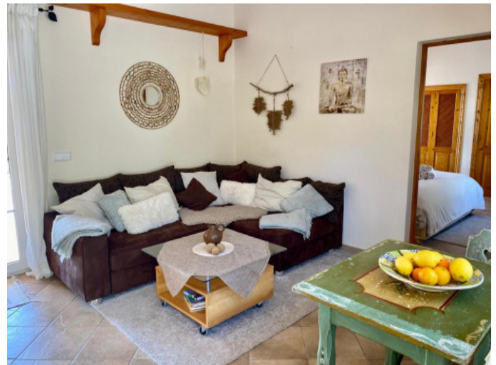
Salón casa invitados