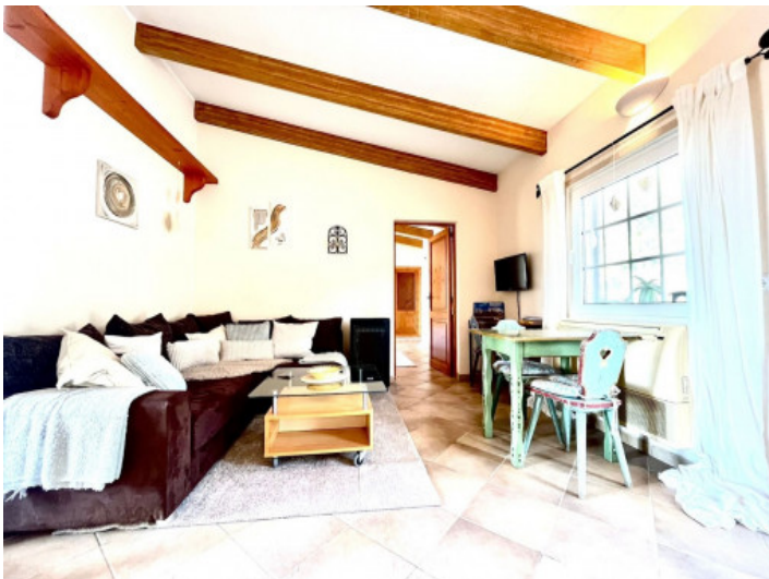
Salón casa invitados