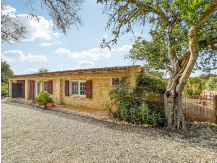
Casa de huéspedes