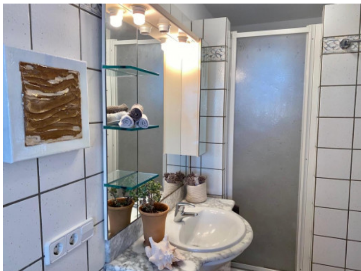
Baño casa invitados