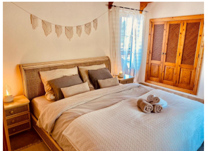
Dormitorio casa invitados

Toda la información como mejor se puede saber, salvo por error durante el periodo de venta. Sirva este documento como un informe previo, las bases legales solo serán válidas a través de un contrato de compra acordado ante Notario.