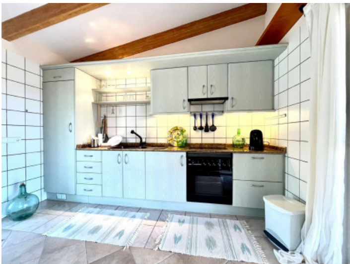
Cocina casa invitados