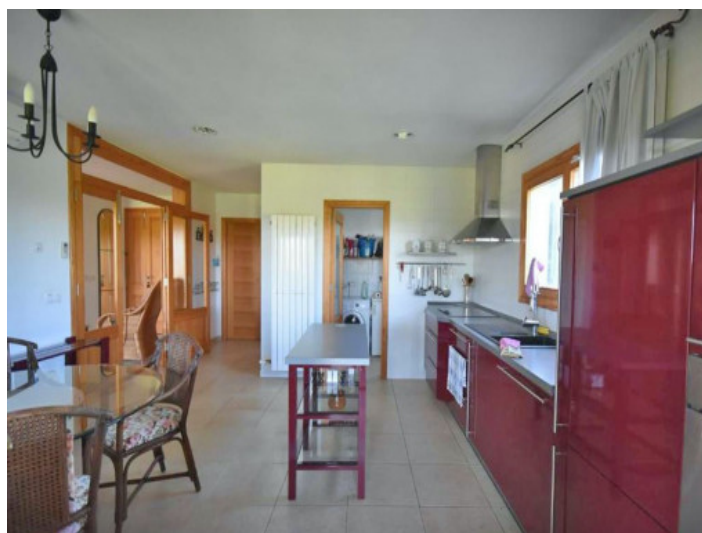
Cocina completamente equipada