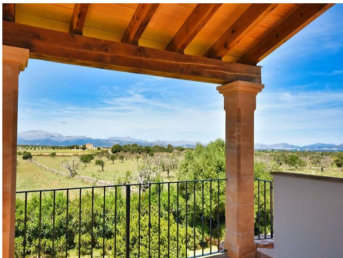
Preciosas vistas lejanas