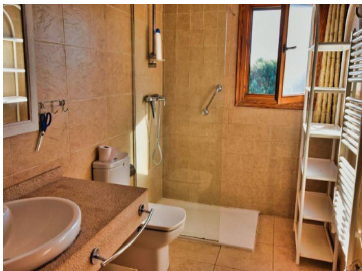
Uno de 4 baños