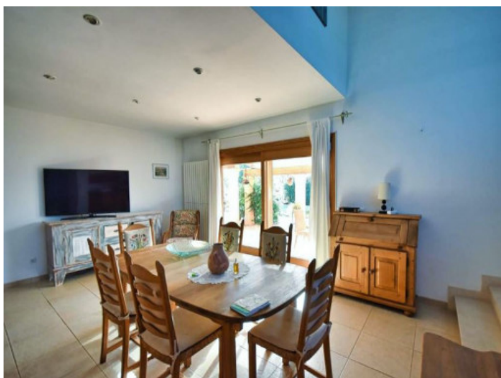
Luminosa zona de comedor