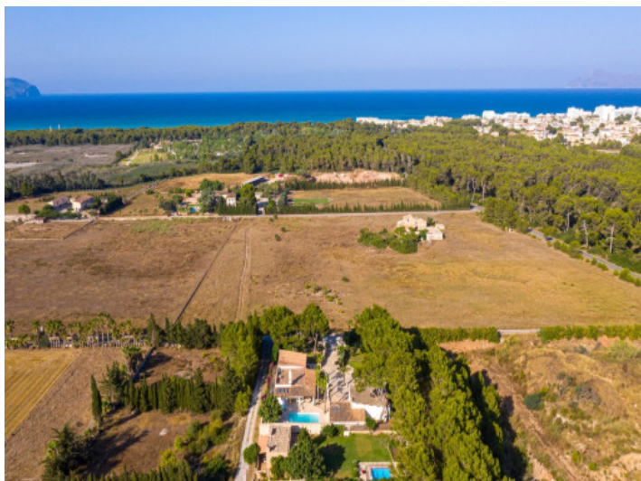
Cerca de la playa