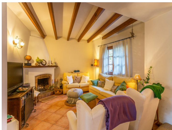
Salón acogedor con chimenea