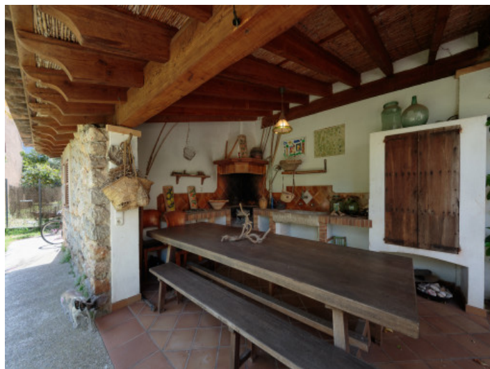
Fantástica zona de barbacoa