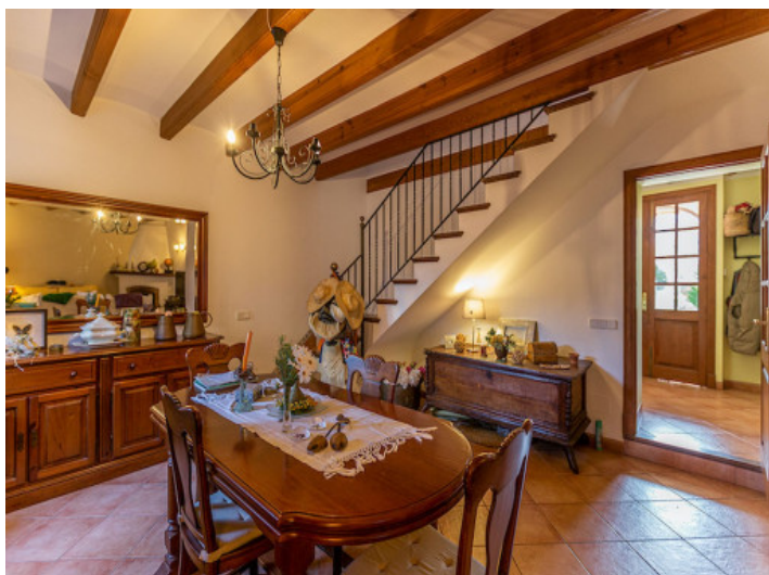
Comedor con vigas de madera