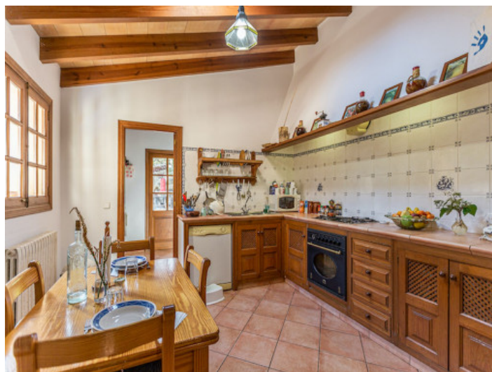
Hermosa cocina rústica

Toda la información como mejor se puede saber, salvo por error durante el periodo de venta. Sirva este documento como un informe previo, las bases legales solo serán válidas a través de un contrato de compra acordado ante Notario.