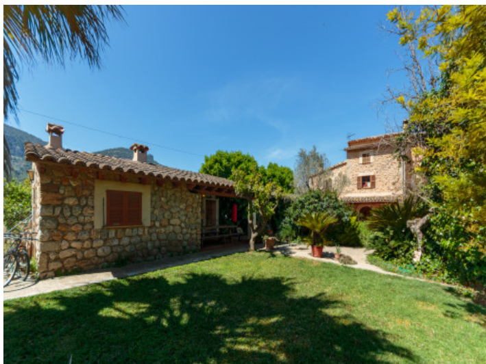
Finca hermosa con encanto cerca de Soller