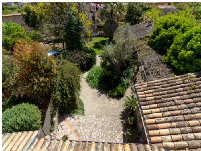
Terraza y jardín