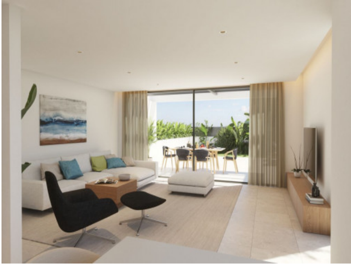
Sala de estar luminosa