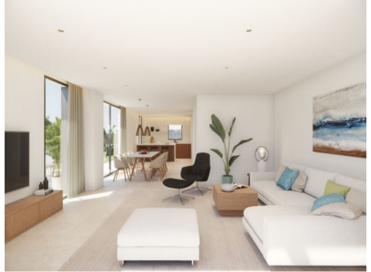
Vista alternativa a la sala de estar