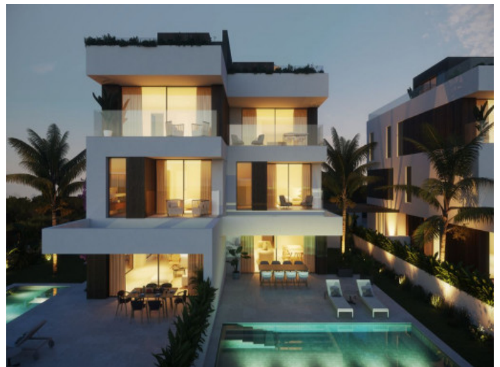
La casa por la noche

Toda la información como mejor se puede saber, salvo por error durante el periodo de venta. Sirva este documento como un informe previo, las bases legales solo serán válidas a través de un contrato de compra acordado ante Notario.