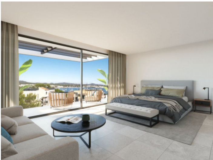
Dormitorio con una vista