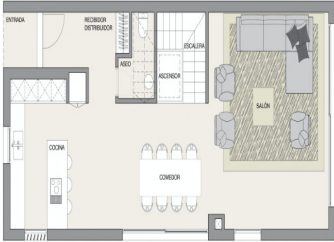
Typ A - Planta Baja