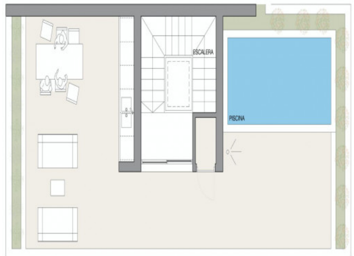
Typ A - Azotea

Toda la información como mejor se puede saber, salvo por error durante el periodo de venta. Sirva este documento como un informe previo, las bases legales solo serán válidas a traves de un contrato de compra acordado ante Notario.