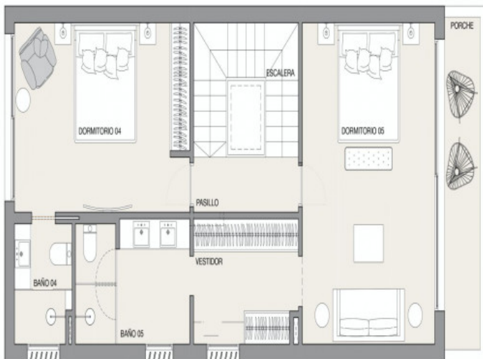
Typ A - Segunda Planta