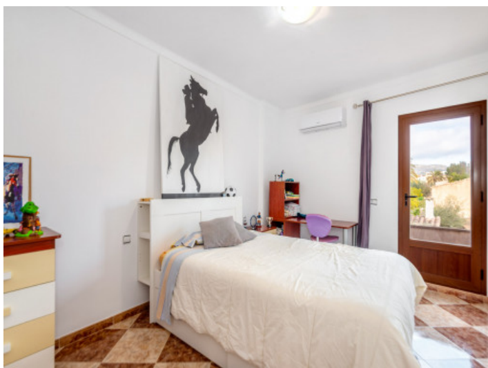
Uno de 4 dormitorios