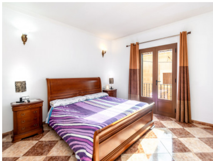
Uno de 4 dormitorios