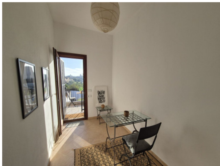
Salida a la azotéa