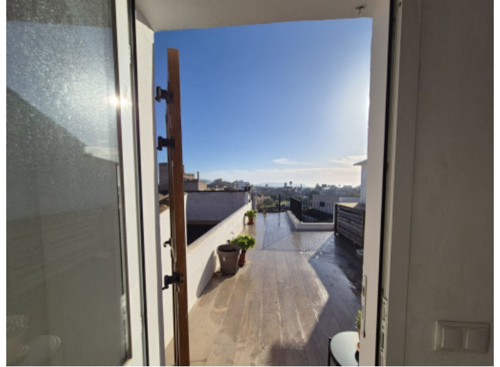
Acceso a la azotéa