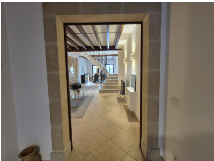
Vistas al Salón - Comedor