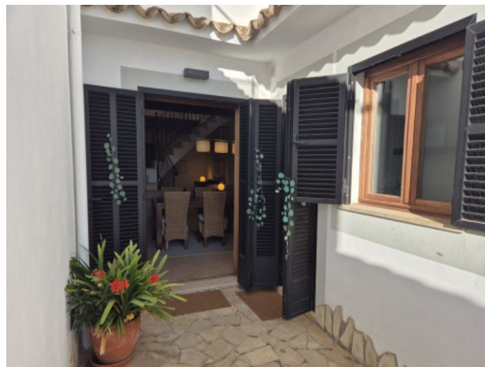
Vista del patio al comedor