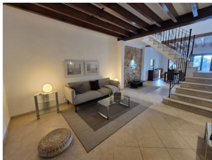
Salón - Comedor