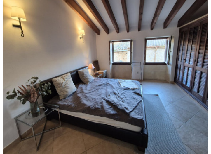
Uno de 4 dormitorios