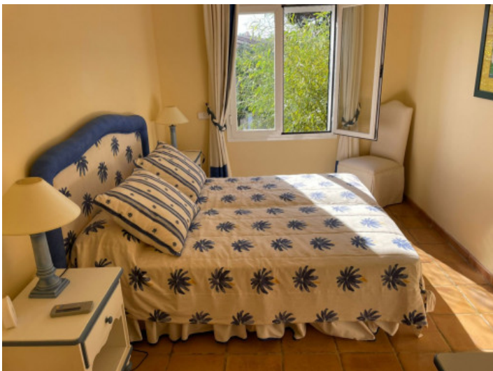
Uno de 8 dormitorios