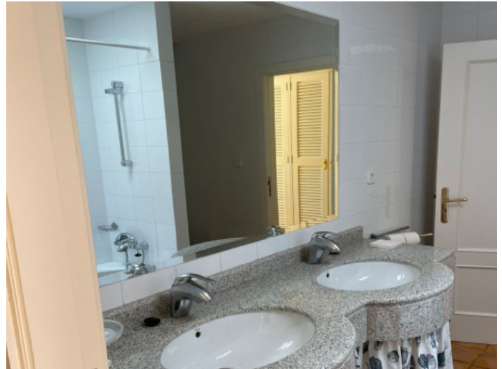
Uno de 8 baños