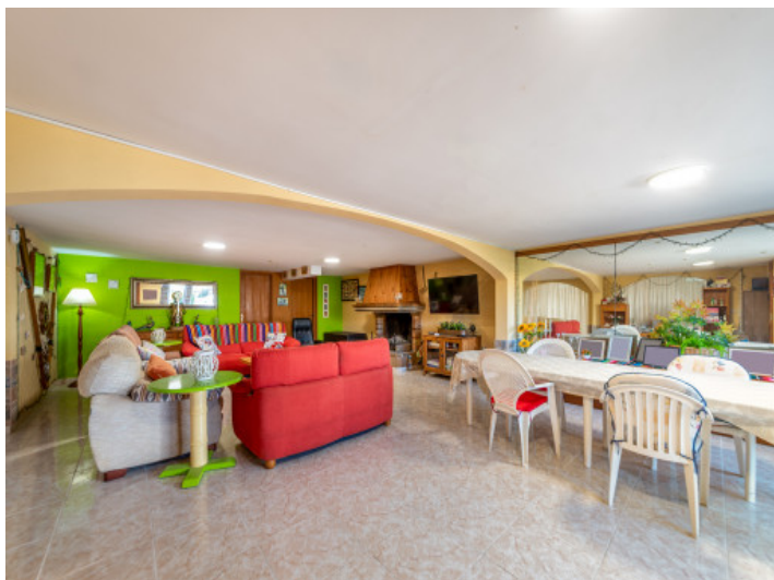
Salón y comedor