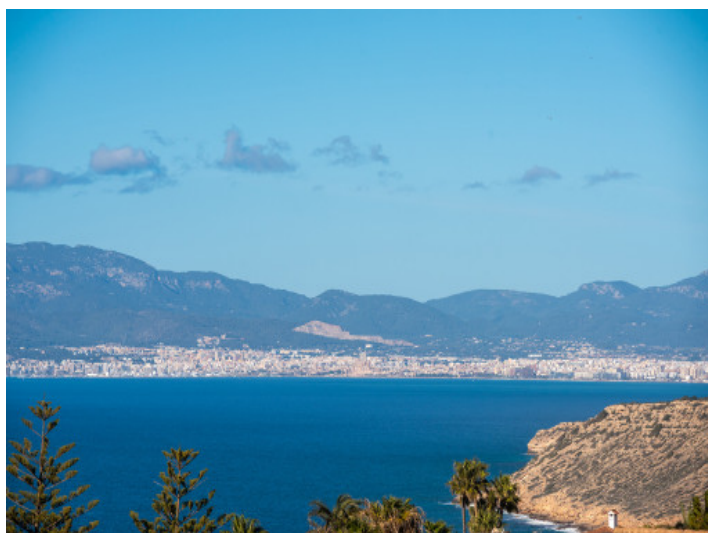
Vistas al mar