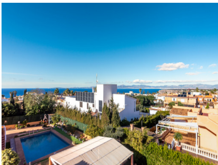
Vistas al mar