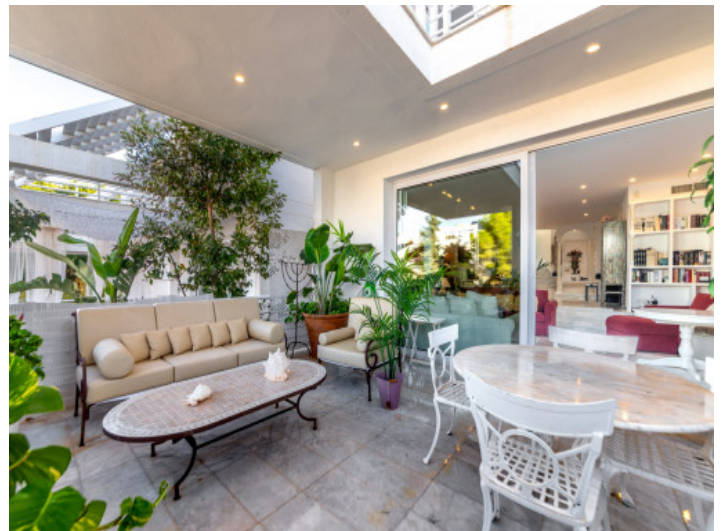
Balcon frente salón