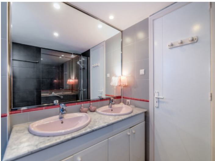
Adosado con 4 baños