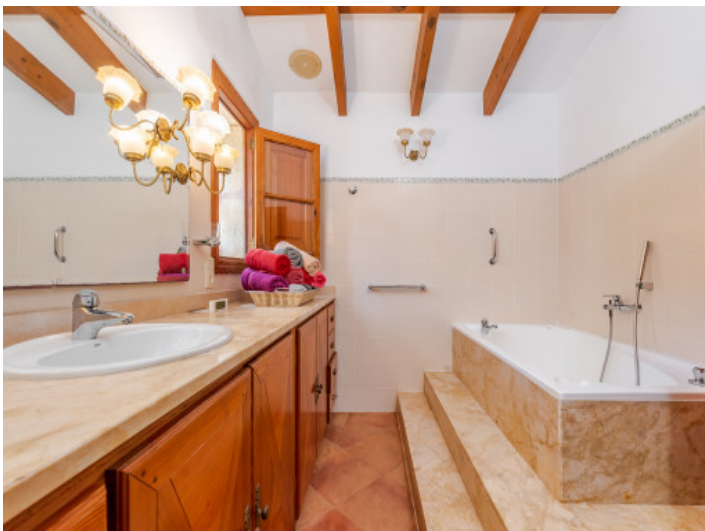
Uno de 4 baños