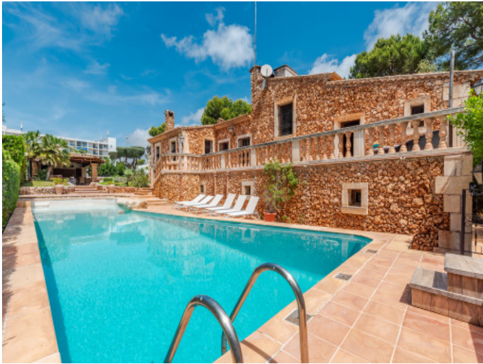
Chalet con piscina, jardín, garaje y licencia de alquiler vacacional en Costa de los Pinos