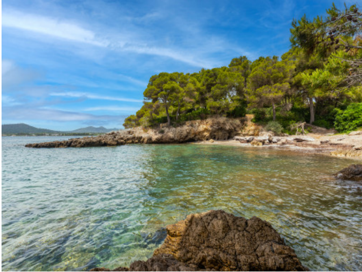
Ubicación junto al mar