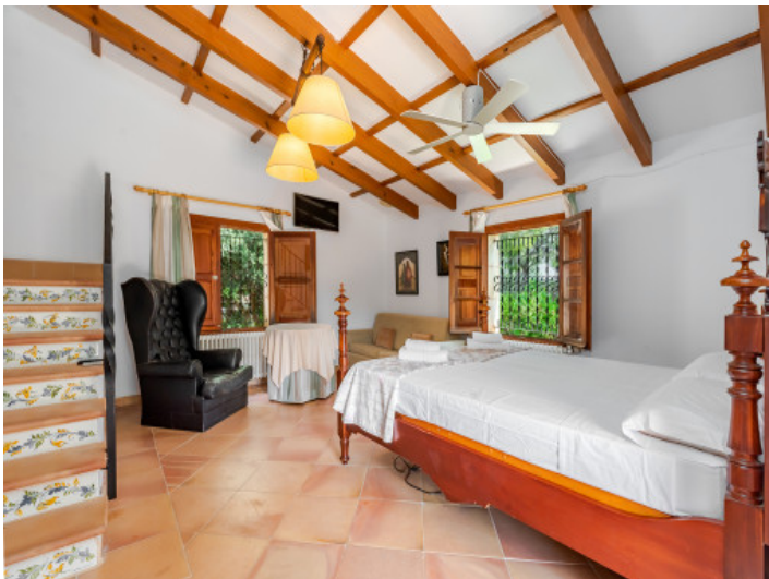
Uno de 5 dormitorios