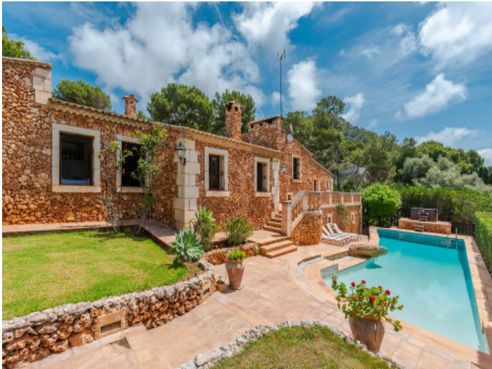
Preciosa zona de piscina