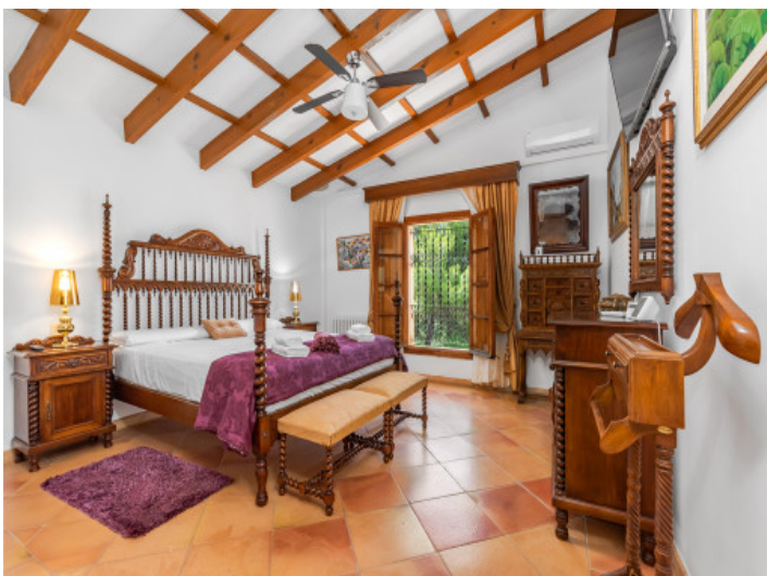
Uno de 5 dormitorios