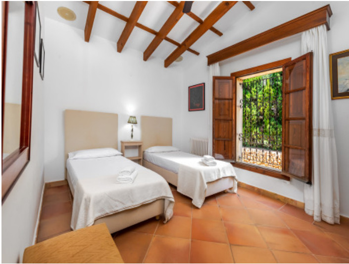
Uno de 5 dormitorios