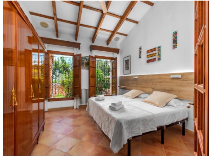
Uno de 5 dormitorios