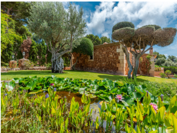
Jardín muy cuidado