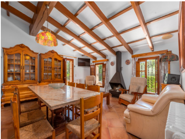
Salón-comedor con chimenea