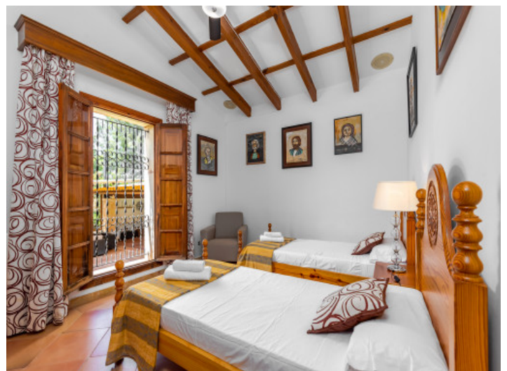
Uno de 5 dormitorios

Toda la información como mejor se puede saber, salvo por error durante el periodo de venta. Sirva este documento como un informe previo, las bases legales solo serán válidas a través de un contrato de compra acordado ante Notario.