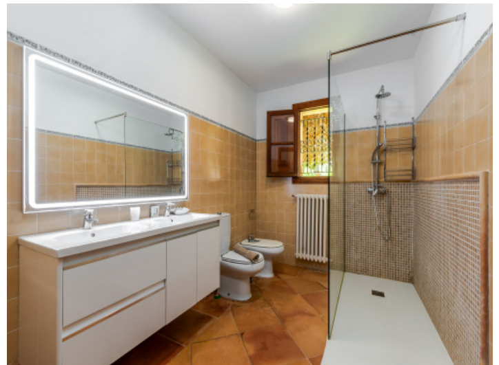
Uno de 4 baños