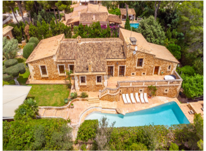
Vista desde arriba