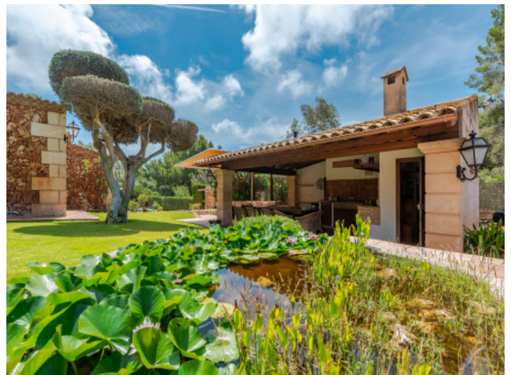
Casita con cocina de verano

Toda la información como mejor se puede saber, salvo por error durante el periodo de venta. Sirva este documento como un informe previo, las bases legales solo serán válidas a través de un contrato de compra acordado ante Notario.