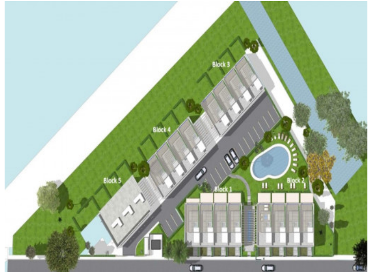
Plano de la comunidad

Toda la información como mejor se puede saber, salvo por error durante el periodo de venta. Sirva este documento como un informe previo, las bases legales solo serán válidas a traves de un contrato de compra acordado ante Notario.