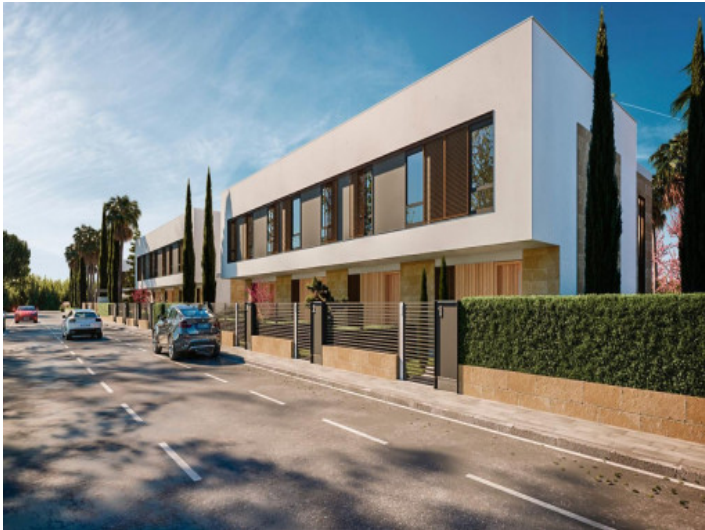
Vista a la fachada