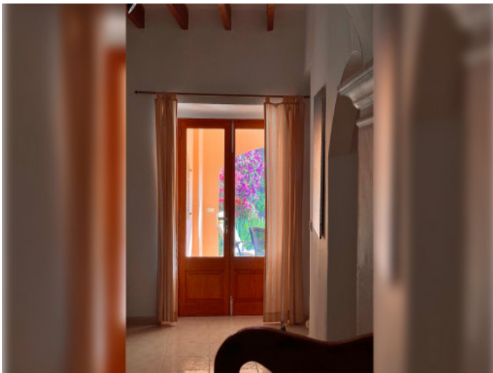
Acceso a la terraza