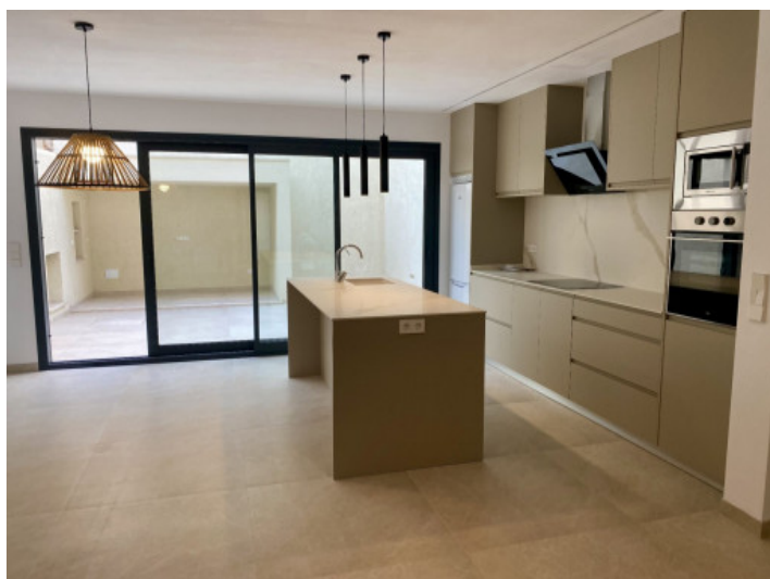
Cocina moderna y acceso al patio