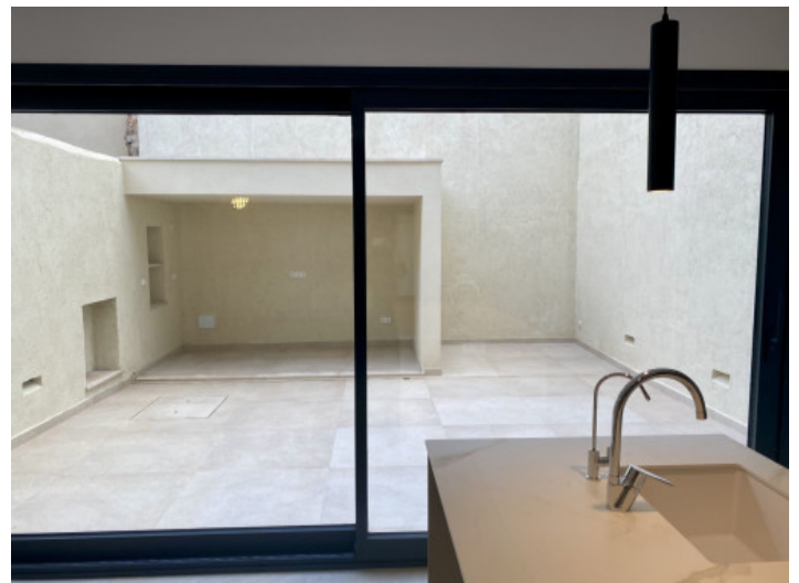
Vistas al patio

Toda la información como mejor se puede saber, salvo por error durante el periodo de venta. Sirva este documento como un informe previo, las bases legales solo serán válidas a través de un contrato de compra acordado ante Notario.