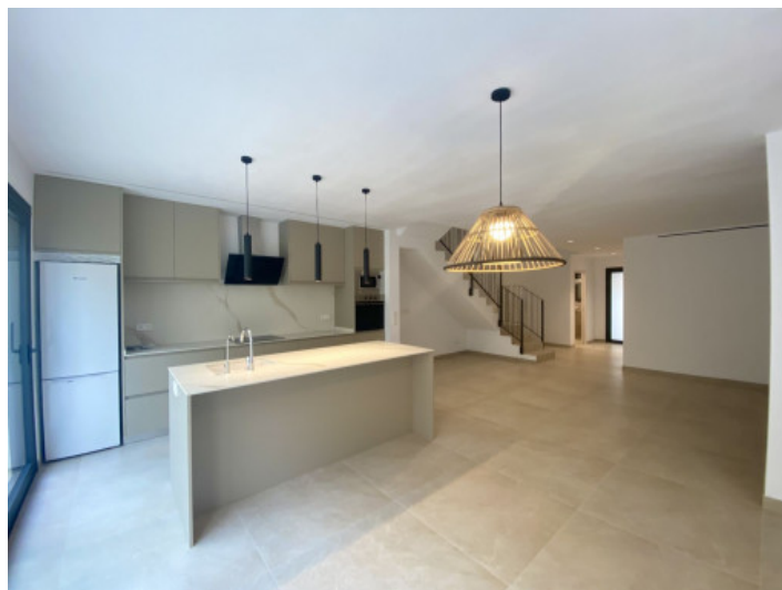
Cocina y salón