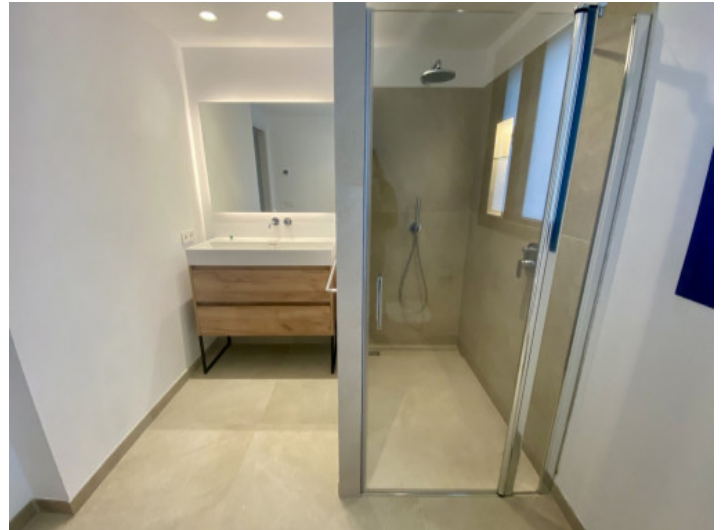
Casa con 2 baños

Toda la información como mejor se puede saber, salvo por error durante el periodo de venta. Sirva este documento como un informe previo, las bases legales solo serán válidas a traves de un contrato de compra acordado ante Notario.