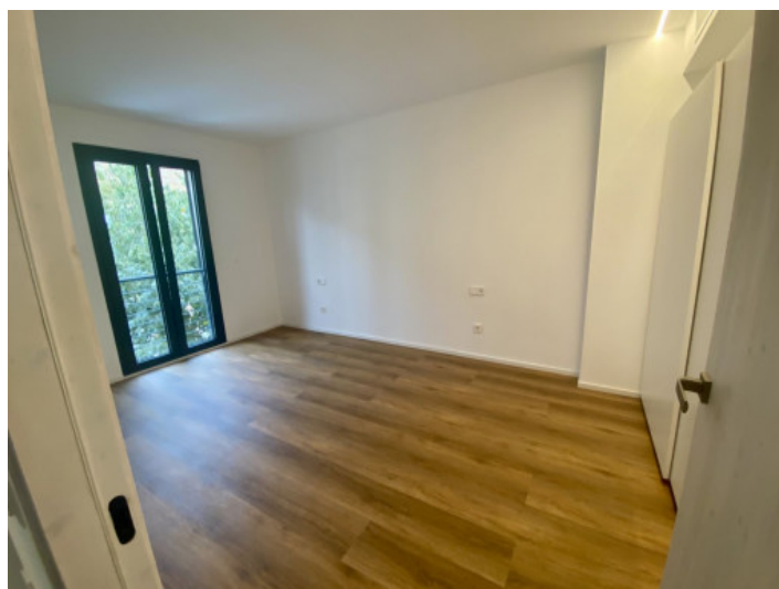
Uno de 2 dormitorios