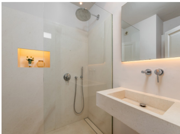
Baño con ducha