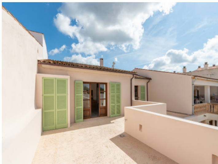
Terraza en la primera planta