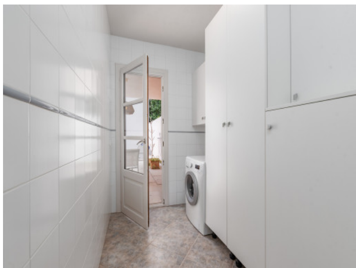
Cuarto de servicio separado