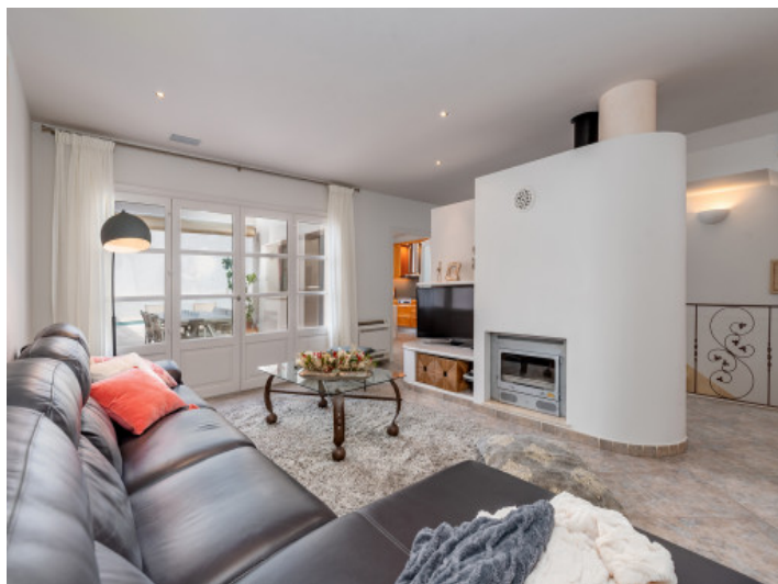
Salón con chimenea