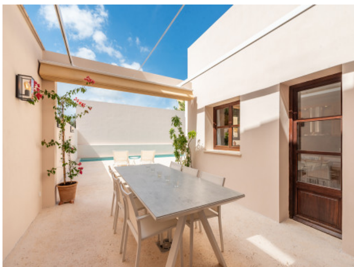
Comedor exterior cerca de la cocina