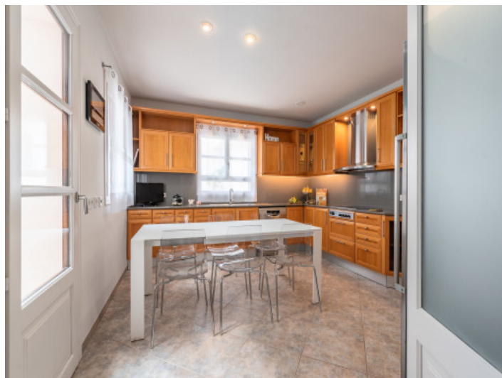
Cocina de estilo rústico