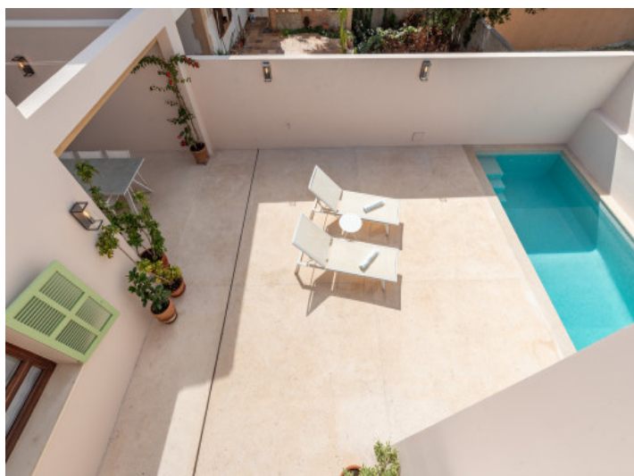
Vistas a la piscina