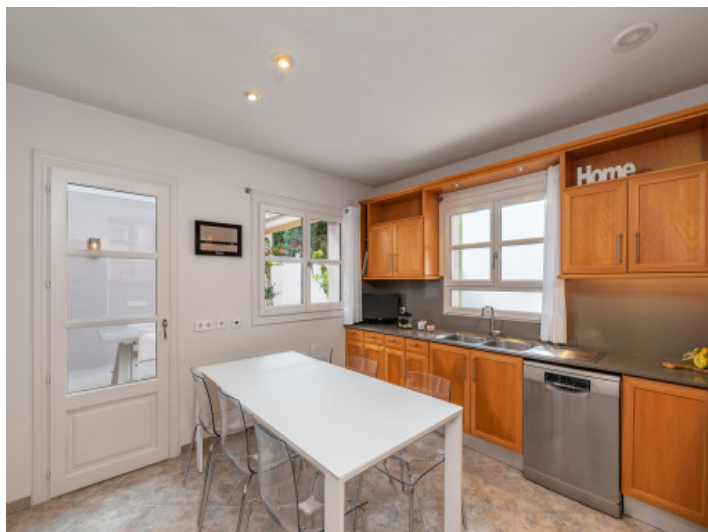
Cocina con acceso directo al patio