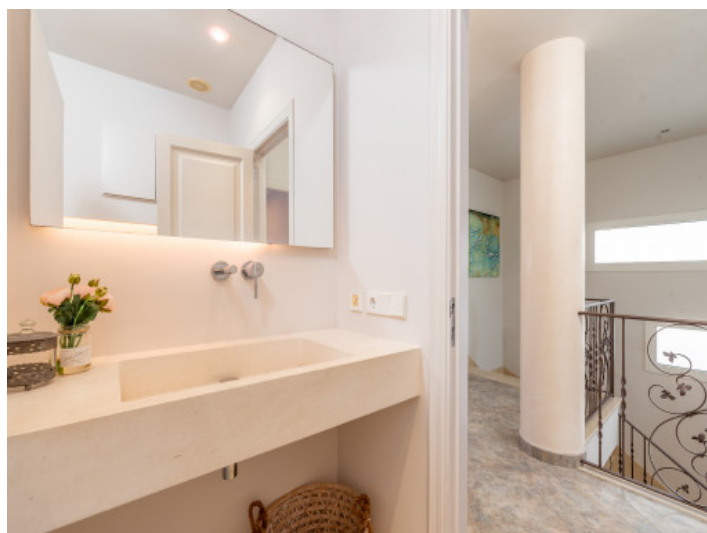
Baño en la primera planta