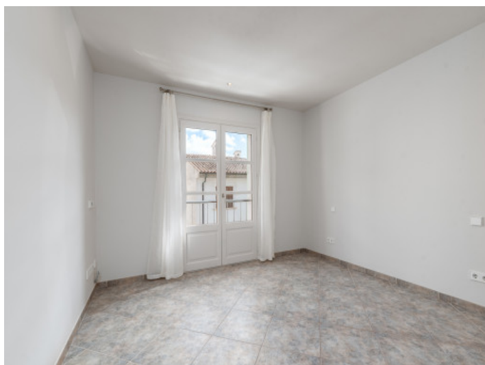
Uno de 4 dormitorios