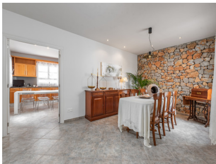
Comedor con pared de piedra natural