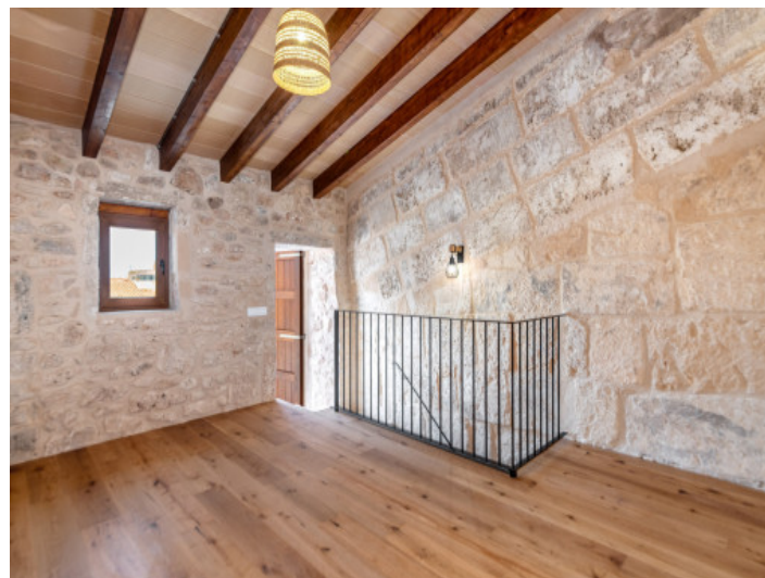
Paredes con piedra vista