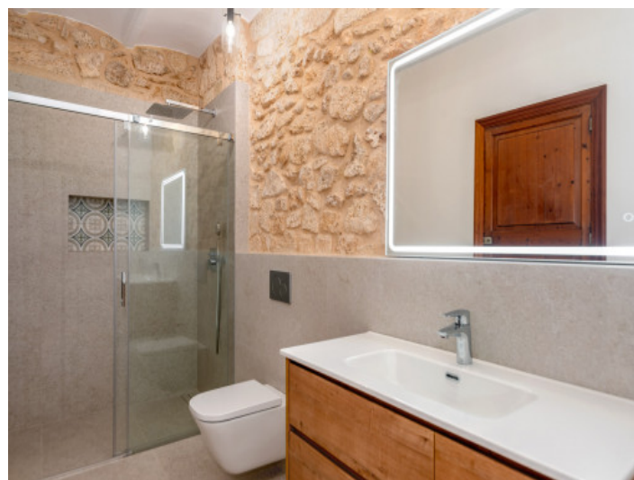
Baño con ducha