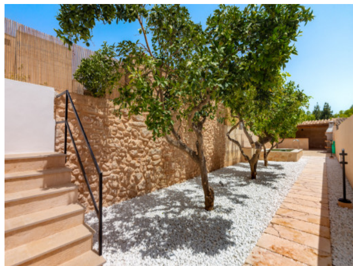
Patio con arboles

Toda la información como mejor se puede saber, salvo por error durante el periodo de venta. Sirva este documento como un informe previo, las bases legales solo serán válidas a través de un contrato de compra acordado ante Notario.