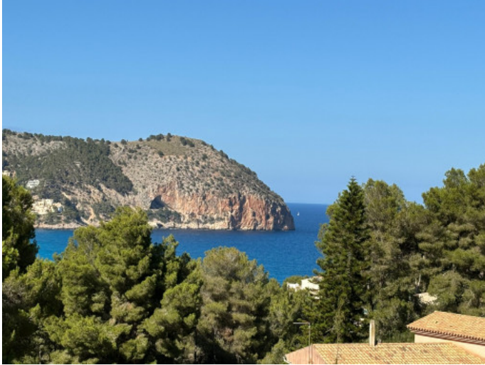
WhatsApp Image 2024-07-04 at 19.53.08