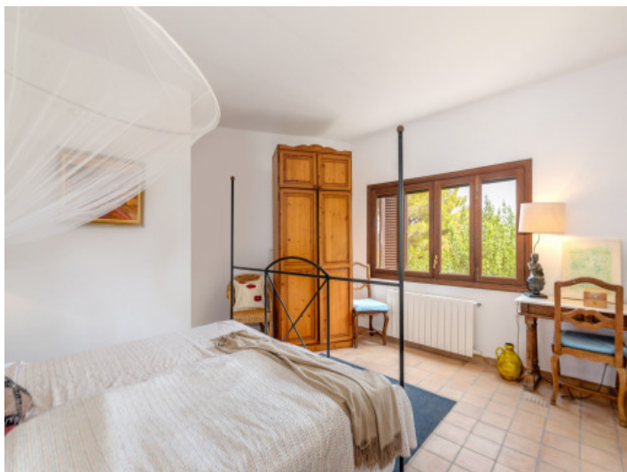
Dormitorio de huéspedes