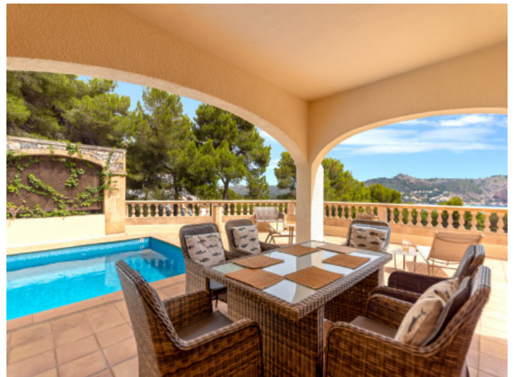
Chalet elegante con magníficas vistas al mar a poca distancia de una