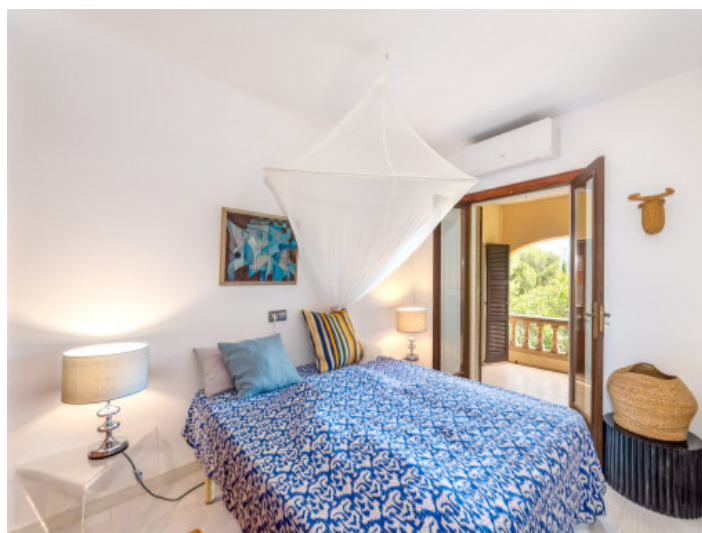
Dormitorio de huéspedes