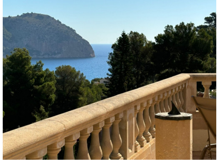
WhatsApp Image 2024-07-04 at 19.53.47