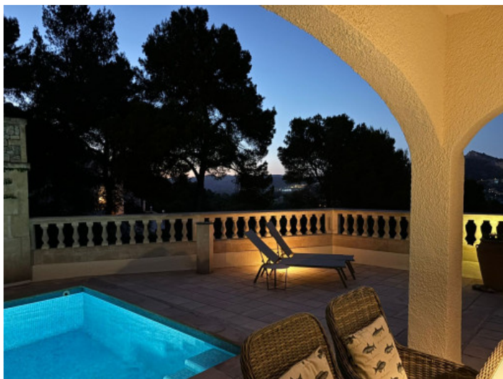
Terraza con luz