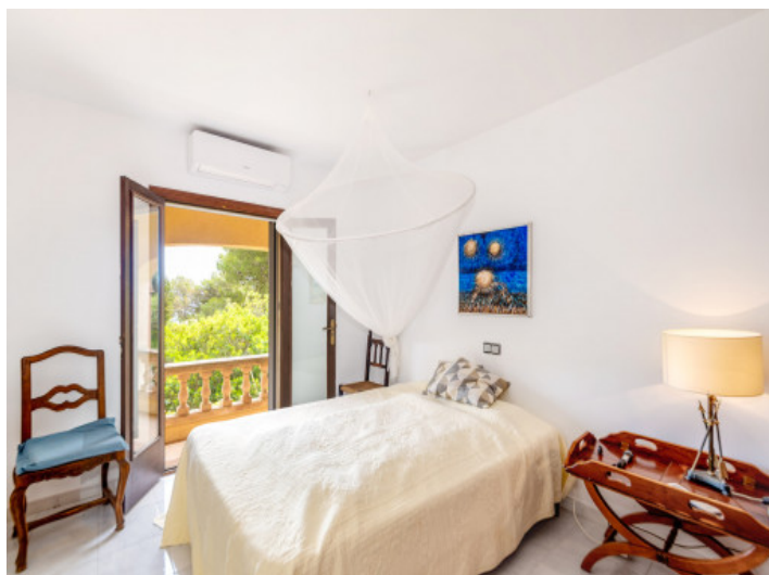
Dormitorio de huéspedes