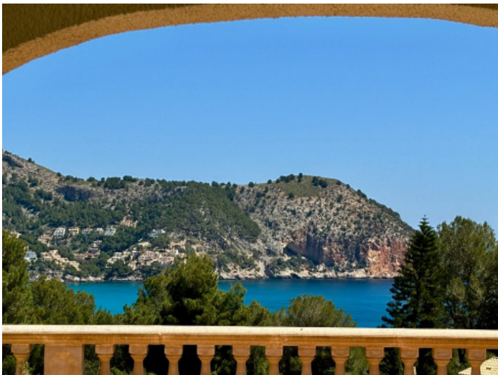
WhatsApp Image 2024-07-05 at 11.36.13