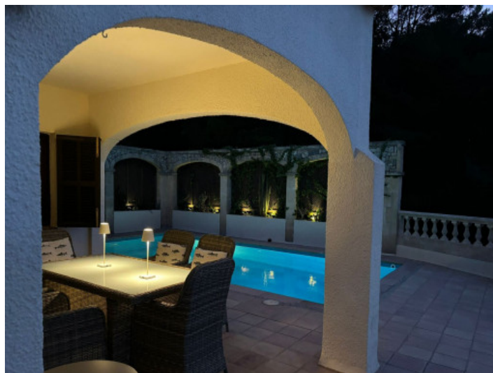
Terraza con luz