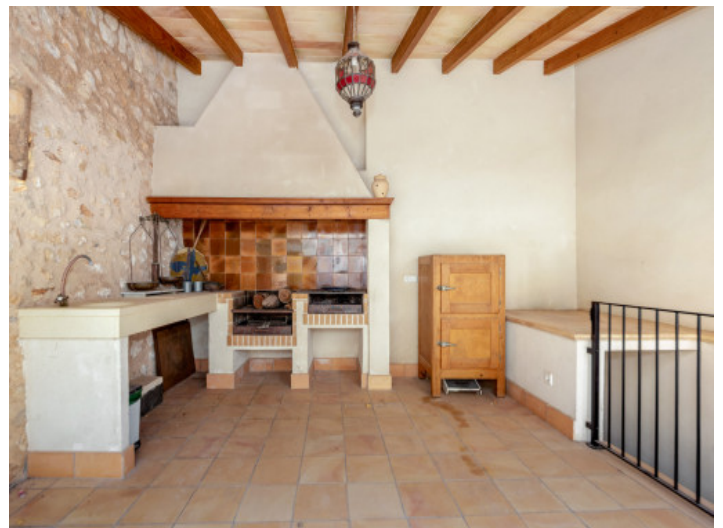
Área de barbacoa

Toda la información como mejor se puede saber, salvo por error durante el periodo de venta. Sirva este documento como un informe previo, las bases legales solo serán válidas a través de un contrato de compra acordado ante Notario.