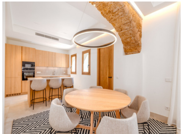
Comedor y cocina

Toda la información como mejor se puede saber, salvo por error durante el periodo de venta. Sirva este documento como un informe previo, las bases legales solo serán válidas a través de un contrato de compra acordado ante Notario.