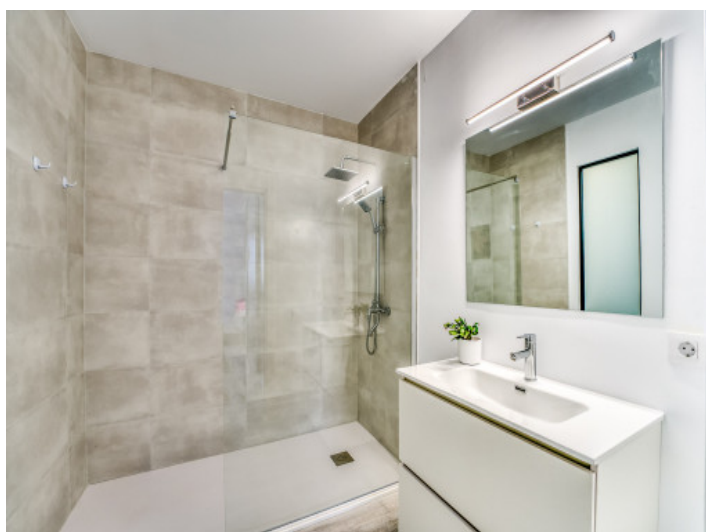
Uno de 4 baños