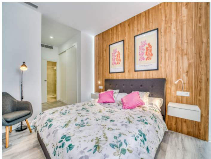
Uno de 3 dormitorios