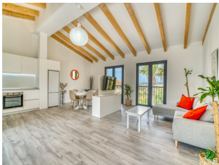
Salón - Comedor