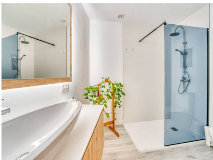
Uno de 4 baños