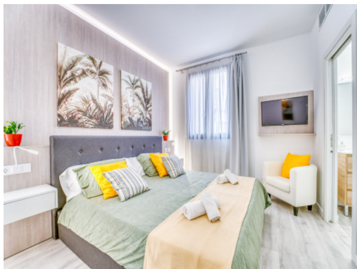
Uno de 3 dormitorios

Toda la información como mejor se puede saber, salvo por error durante el periodo de venta. Sirva este documento como un informe previo, las bases legales solo serán válidas a través de un contrato de compra acordado ante Notario.