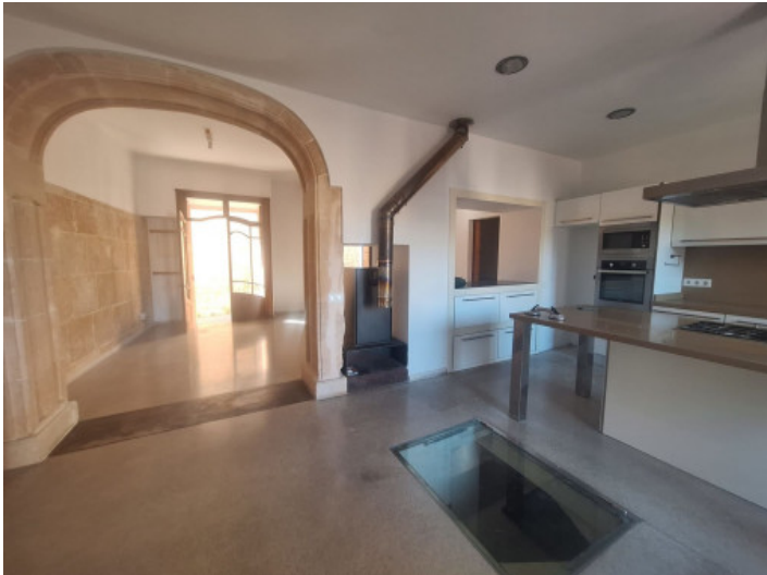
Cocina y comedor