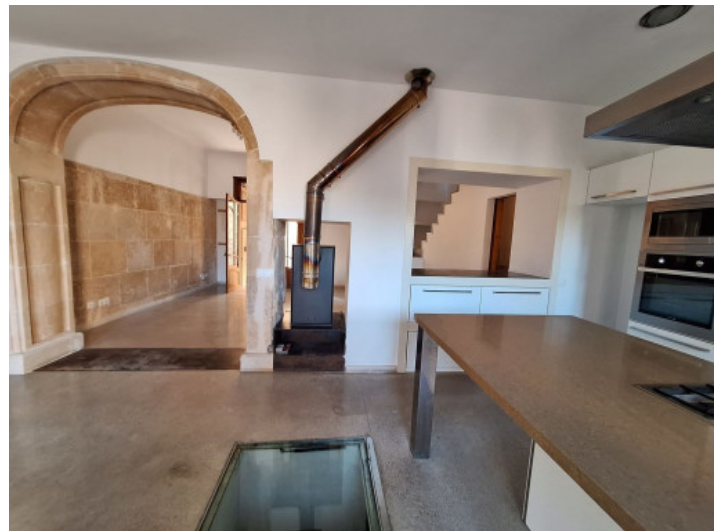
Cocina y acceso a la bodega