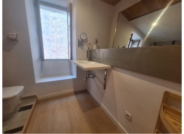
Baño primera planta