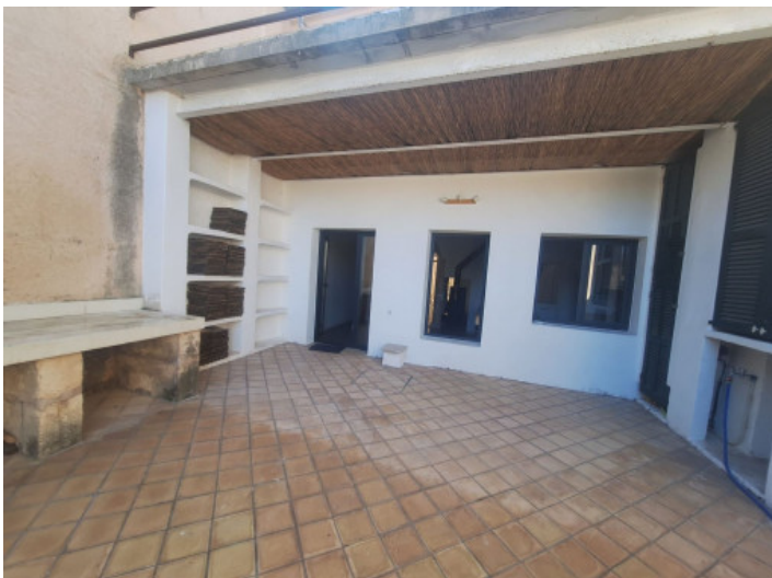
Fachada y patio