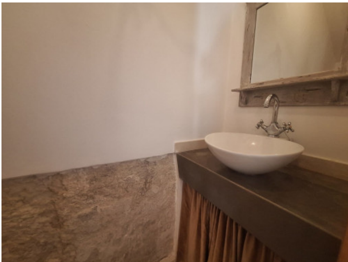
Baño invitados planta baja