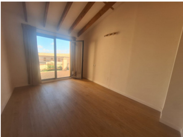
Uno de 3 dormitorios