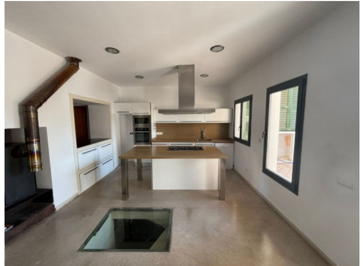
Cocina y acceso a la bodega