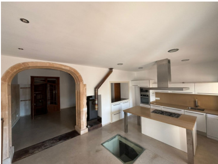
Comedor y cocina