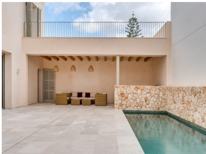
Patio con piscina