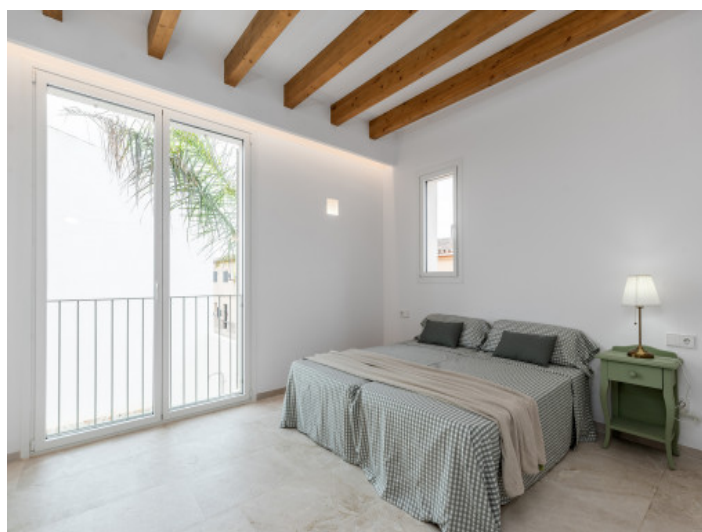
Todos los dormitorios con baño en suite

Toda la información como mejor se puede saber, salvo por error durante el periodo de venta. Sirva este documento como un informe previo, las bases legales solo serán válidas a través de un contrato de compra acordado ante Notario.