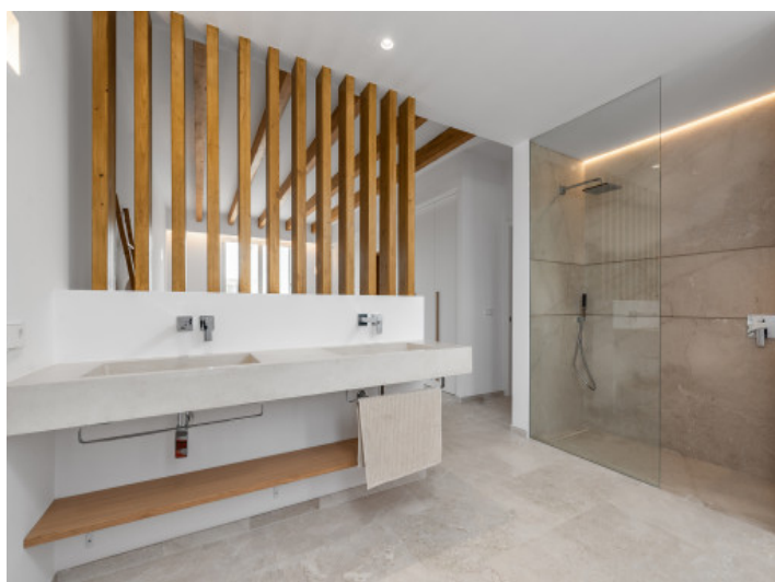
Baño dormitorio principal