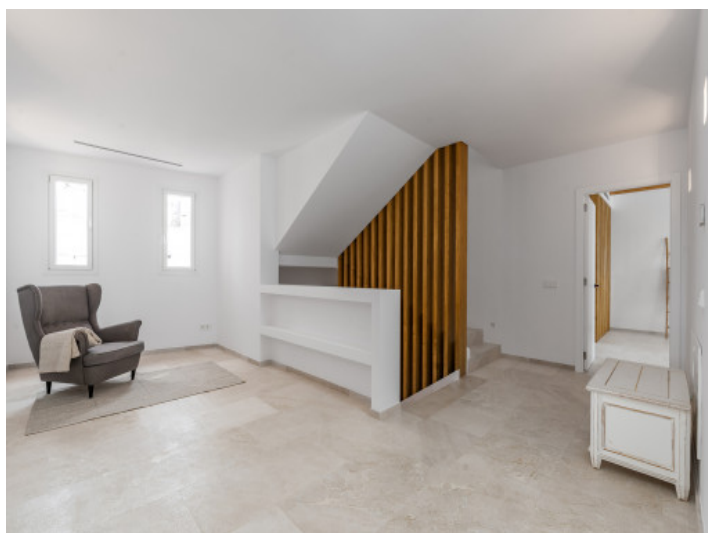
Descansillo primera planta